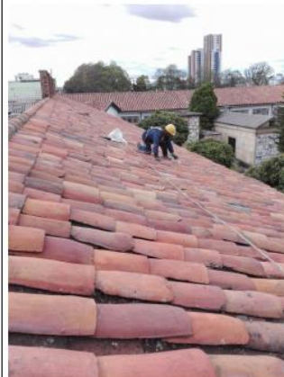
Después de lavada con repaso de espátula Agosto 23 del 2020