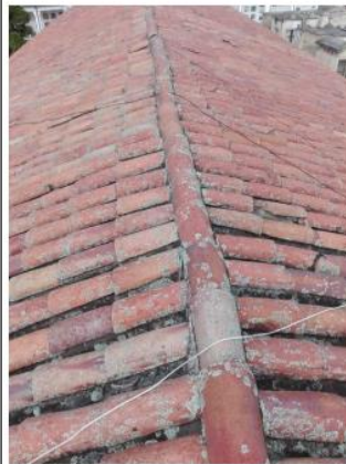
Antes de la hidro lavadora y espátula. Agosto 19, 20 de 2020