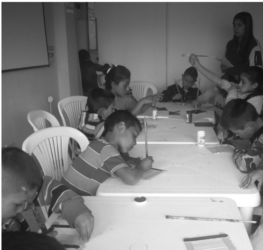
Elaboración de portarretratos para el día de la madre en Mochuelo Alto.

Durante los meses de mayo y junio se continuó trabajando en el manejo y ocupación del tiempo libre, a través de actividades lúdicas y recreativas dirigidas a la población infantil.