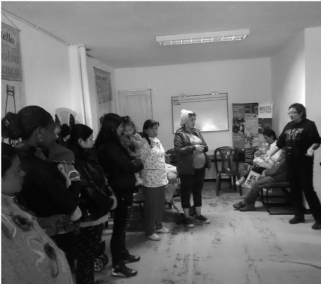
Grupo de madres gestantes en talleres lúdicos. Instituto de Bienestar Familiar.

Excelente tarea reporta la Oficina de Gestión Social de la Unidad Administrativa de Servicios Públicos, en Mochuelo Bajo, en el periodo actual se realizó atención personalizada a cerca de 350 personas del sector, la consulta de trabajos escolares especialmente a los estudiantes del grupo de Canapro, se facilitó el Salón para el desarrollo de los compromisos adquiridos con anticipación con la Secretaría de Integración Social, con el Hospital Vista Hermosa, el Instituto Colombiano de Bienestar Familiar y demás entidades del Distrito que hacen presencia en la zona.