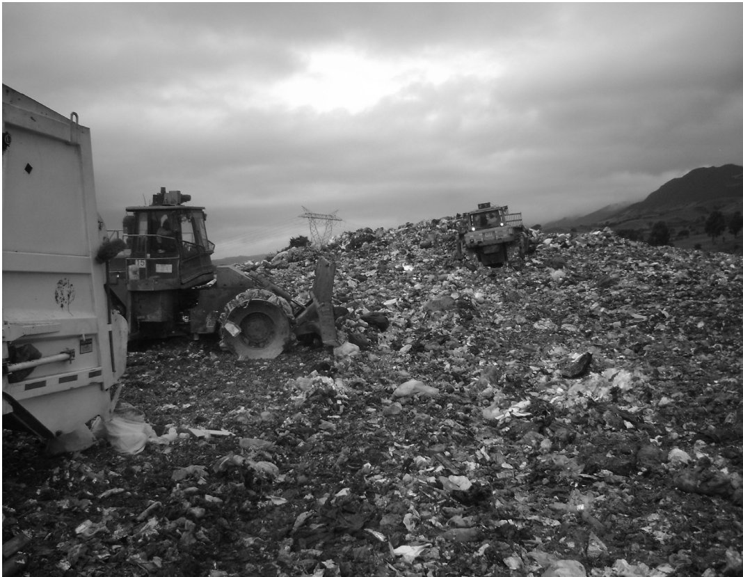
Actividades de disgregación y compactación de residuos.

En este periodo, se logró la cobertura temporal de residuos con material sintético de 63.215 metros cuadrados y en material natural arcilloso el cubrimiento de 301.410 m 2 .