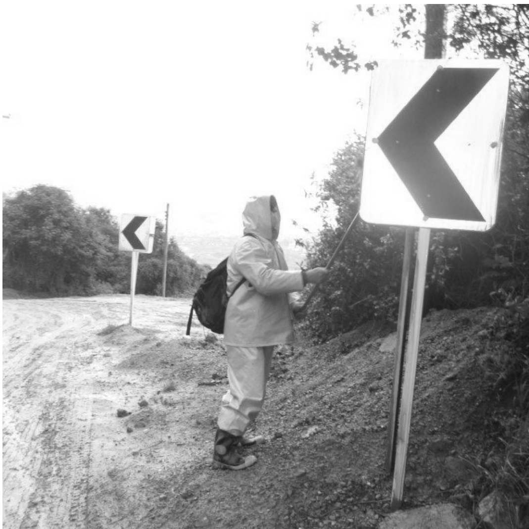
Personal de CGR, realiza actividades de mantenimiento a la señalización en el interior del RSDJ.

Es necesario recordarle a la comunidad que las personas que lleven la hoja de vida a las oficinas de relaciones con la comunidad, deben anexar la certificación de residencia, expedida por la Junta de Acción Comunal, del barrio donde viven.