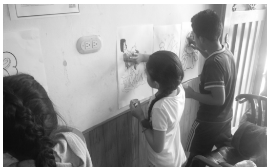
Trabajos manuales con los niños del grupo “encuentros infantiles” de Mochuelo Bajo.

Con la participación de niños y niñas residentes de Mochuelo Alto y Bajo, se adelantó el taller para la elaboración de portarretratos, que se entregaron como regalo en el día de la madre, de igual manera, se llevó a cabo un Cine Club, con la proyección de la película “La vida es bella”, al finalizar la actividad se realizó la retroalimentación del tema y aplicación de conceptos a la vida diaria.