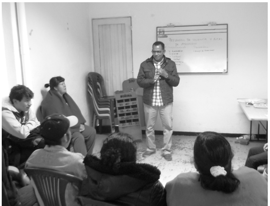
Talleres con profesionales del Hospital Vista Hermosa. Oficina Uaesp.

De igual manera, se atendió los requerimientos en cuanto a préstamo de sillas, juegos de rana y tejo, para desarrollar actividades y encuentros comunitarios, identificados en el territorio, objeto de atención por parte de la Unidad.