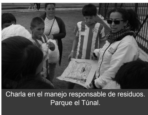
Charla en el manejo responsable de residuos. Parque el Túnal.

El encuentro se llevó a cabo el 30 de mayo en las instalaciones del Parque El Túnal. El equipo Campeón fue "El Recuerdo", también de Ciudad Bolívar, que representaba a Brazil, mientras que el equipo de Mochuelo representó a Chile. Este equipo compuesto por jóvenes, habitantes de la zona de influencia al Relle-