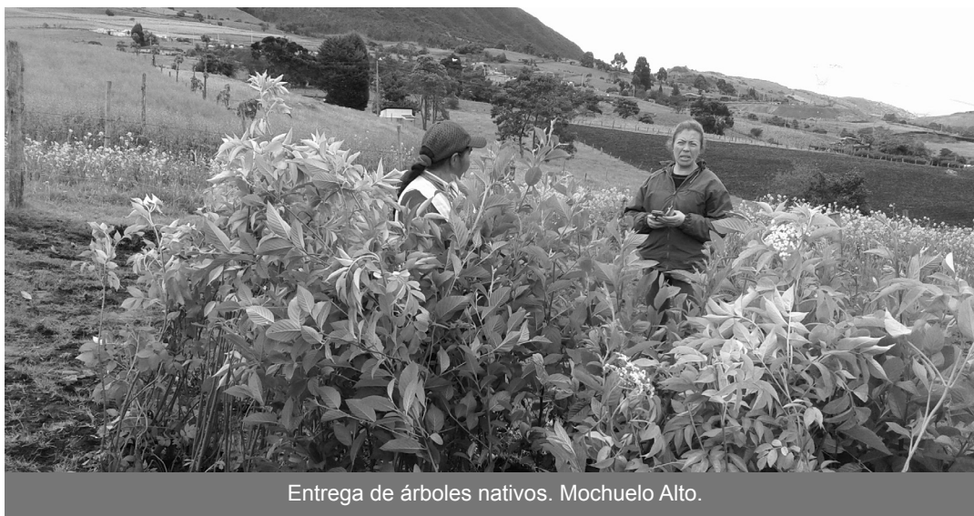
Entrega de árboles nativos. Mochuelo Alto.

Para los meses de mayo y junio, se dictaron Talleres de Diversificación productiva, Manejo de Praderas y Análisis de Suelo a los productores . Con el desarrollo de este programa, La Unidad avanza en la gestión y ejecución del Plan de Gestión Social en la zona, como acción de compensación por cercanía con el Relleno Sanitario Doña Juana.