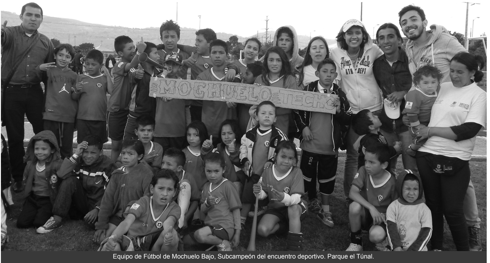
Equipo de Fútbol de Mochuelo Bajo, Subcampeón del encuentro deportivo. Parque el Túnal.

El equipo de fútbol de la vereda Mochuelo Bajo obtuvo el título de Subcampeón en las eliminatorias del Mundialito Techo, actividad coordinada por la Organización "Un Techo para mi País", la cual tiene presencia en Latinoamérica y el Caribe. Esta entidad busca suplir la falta de vivienda y fortalecer los valores comunitarios entre las personas residentes en sectores lejanos y vulnerados a través de acciones conjuntas con los pobladores y jóvenes voluntarios.