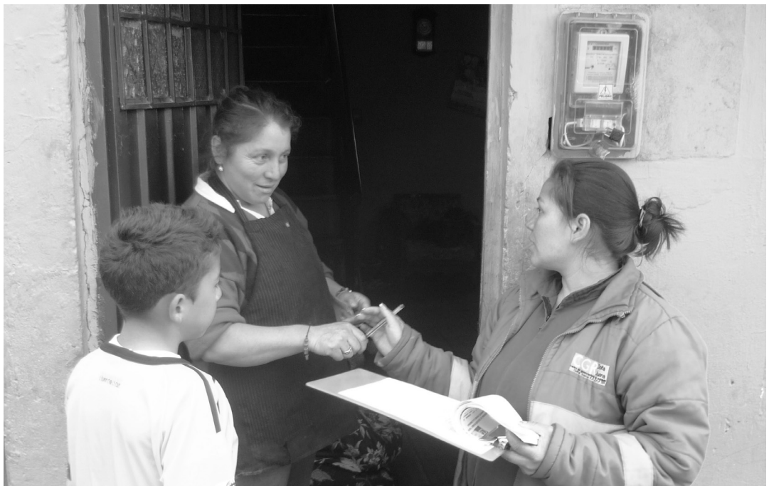
Entrega de volantes a la comunidad para convocar a las actividades definidas. Mochuelo Alto.

Según reporte de la Oficina de Relaciones con la Comunidad del operador, se realizó la entrega de volantes, se fijaron afiches en lugares públicos, se realizaron llamadas telefónicas, con el objeto de convocar a la comunidad a la participación activa, contando con la asistencia de aproximadamente 50 personas en cada una de las actividades mencionadas.