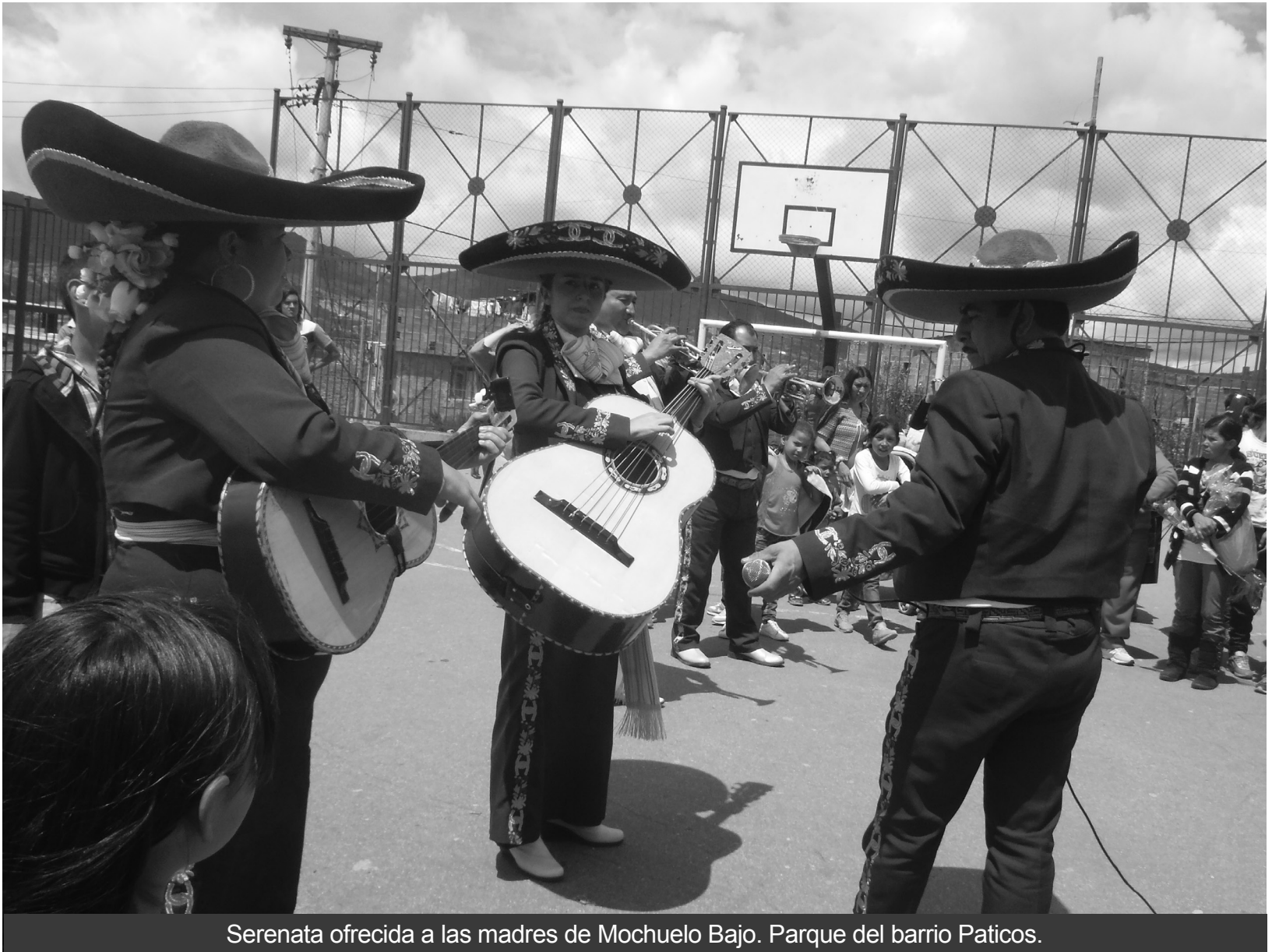
Serenata ofrecida a las madres de Mochuelo Bajo. Parque del barrio Paticos.

Las actividades previstas por el Centro de Gerenciamiento de Residuos, Doña Juana, para celebrar el día de la Madre, se llevaron a cabo en la vereda de Mochuelo Bajo y Mochuelo Alto, con la asistencia de cerca de quinientas mujeres, residentes del sector, mujeres luchadoras, comprometidas y emprendedoras que merecen toda muestra de gratitud y elogio.