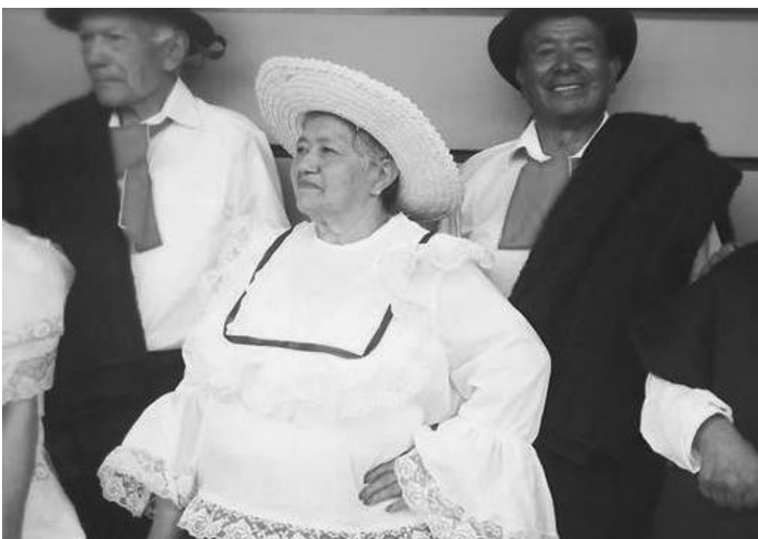
Integrantes del Grupo de Danza - Los Alegres Muchachos. Mochuelo Bajo.

Dentro del repertorio, este grupo de danzas, formado por cinco parejas, están las representaciones de la cumbia, el pasillo, la carranga, la guabina y géneros bailables, como; "Cien años de soledad" de Totó la Momposina, "La Gata Golosa", "Julia Julia, Julia", "La Pringamoza" y La "Guabina Chiquinquireña", entre otros temas, forman parte de su repertorio.