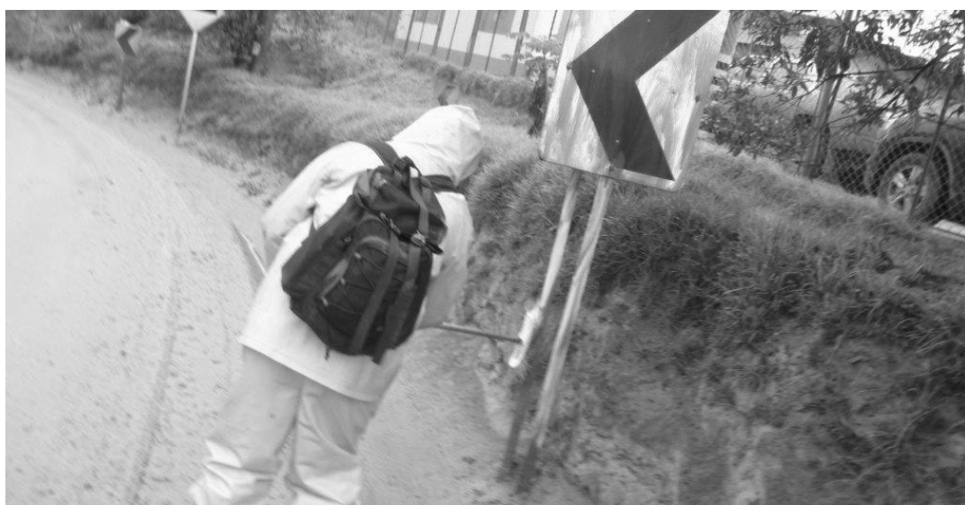
Mantenimiento de vías y limpieza de señalización al interior del RSDJ.

Es necesario recordarle a la comunidad que las personas que lleven la hoja de vida a las oficinas de relaciones con la comunidad, deben anexar la certificación de residencia.