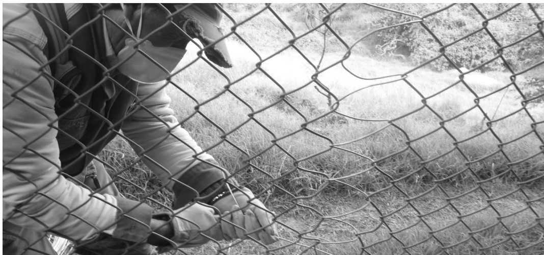
Reparación de la malla perimetral del relleno sanitario.

La reparación de la malla perimetral del relleno es una actividad que requiere constante atención, se cambió el extractor y se instaló el sistema de descargue y desfogue del tanque de almacenamiento del reactor biológico en el pondaje de lixiviados, entre otras actividades que mejoran las condiciones de bienestar y de trabajo para de los diferentes equipos del Centro de Gerenciamiento de Residuos, Doña Juana.