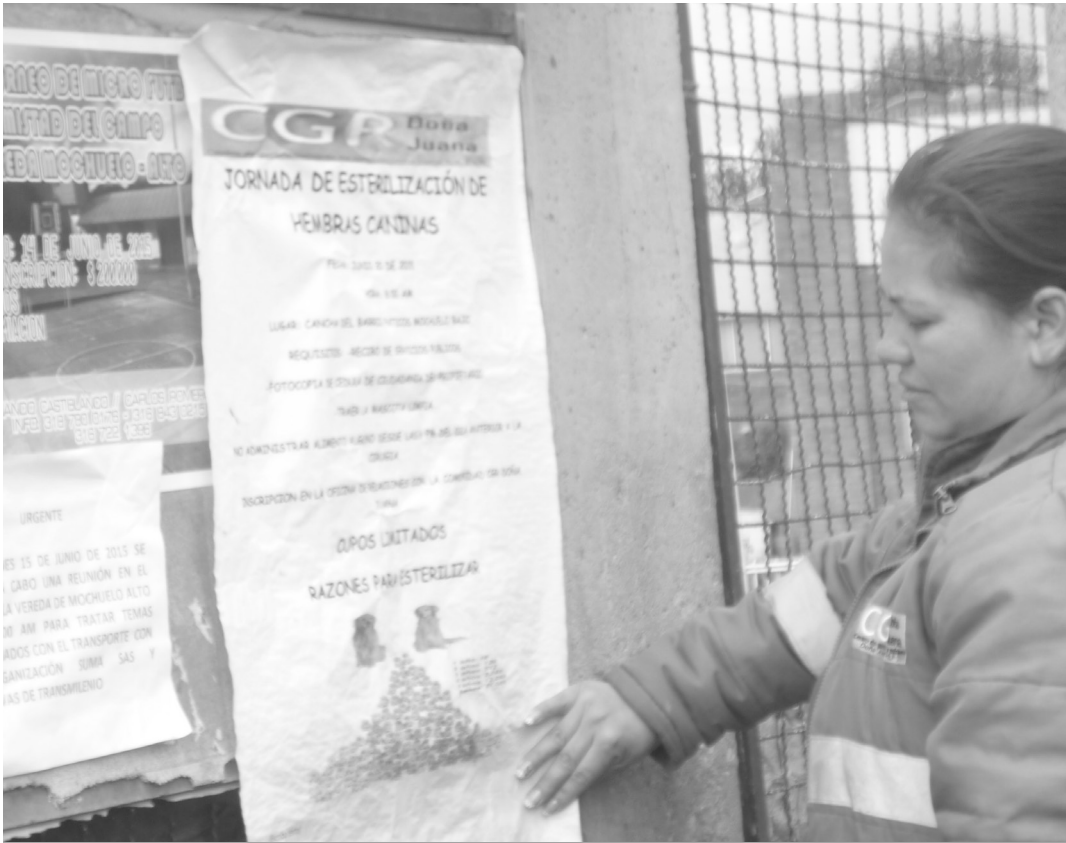
Jornada de colocación de afiches para convocar a la comunidad Mochuelo Alto

El Centro de Gerenciamiento de Residuos, Doña Juana CGR, programó sus compromisos mes a mes, relacionado con las actividades del Plan de Gestión Social.