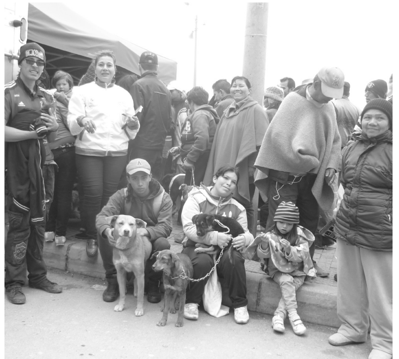
Comunidad residente del sector se concentró en el parque Patiscos en compañía de sus mascotas.

Con la participación de la Secretaría Distrital de Salud y el Operador del Relleno Sanitario Doña Juana, el pasado 20 de junio, se llevó a cabo una jornada de esterilización de perros y gatos, en las inmediaciones del barrio Patiscos, estas mascotas fueron inscritas por sus propietarios con anterioridad, en la oficina de relaciones con la comunidad del CGR, Doña Juana en Mochuelo Alto y Mochuelo Bajo.