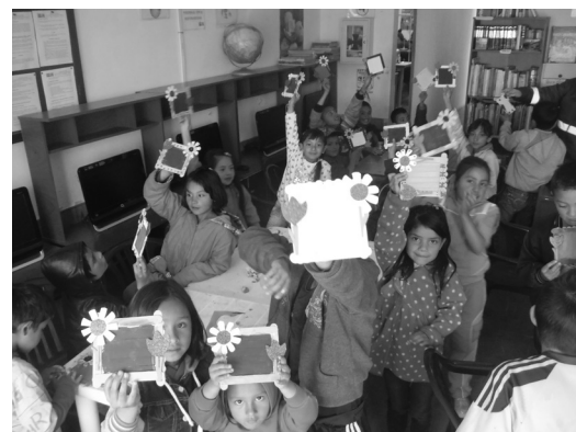
Portarretratos listos para el día de la madre, niños de Mochuelo Bajo.

Durante los meses de mayo y junio se continuó trabajando en el manejo y ocupación del tiempo libre, a través de actividades lúdicas y recreativas dirigidas a la población infantil.