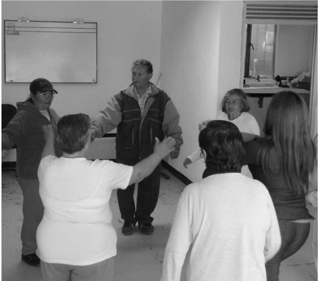
Ensayo del grupo de danza "Los Alegres Muchachos" – Oficina de Gestión Social UAESP.