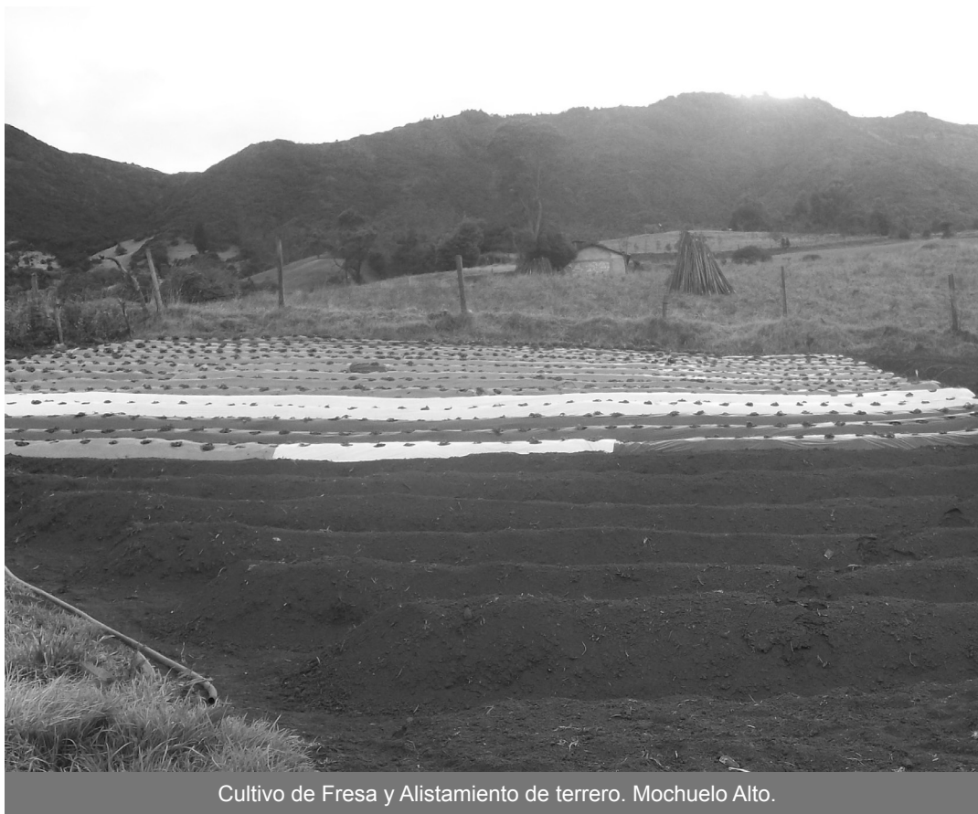
Cultivo de Fresa y Alistamiento de terrero. Mochuelo Alto.

Dentro del cronograma del proyecto, a la fecha se ha entregado a los beneficiarios 2490 kilos de semillas de haba, pastos y maíz. Árboles de pera, manzano, durazno y tomate de árbol, cerca de 9700 plántulas de fresa, curuba, espinacas, ruda, lechuga,