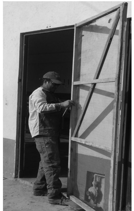
Reparación puerta del casino campamento principal.