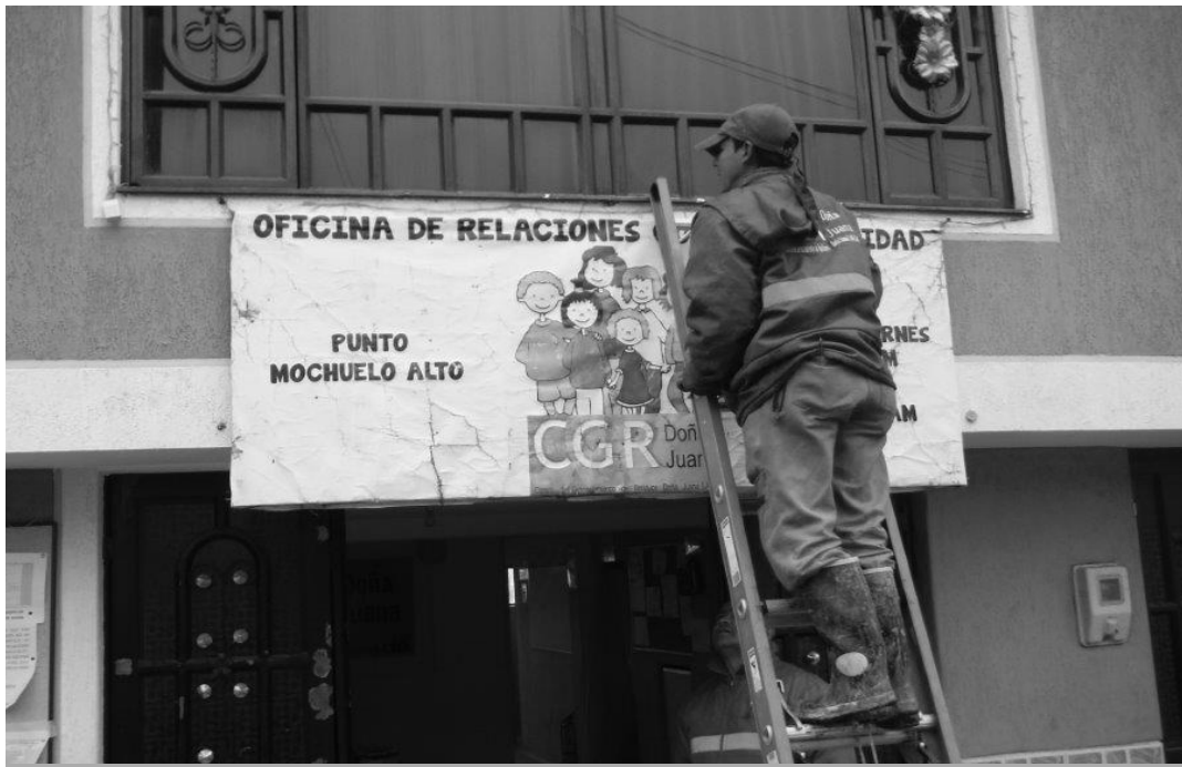
Reparación locativas en la oficina Mochuelo Alto

Con el fin de garantizar el mantenimiento y las condiciones óptimas a las instalaciones físicas de las áreas administrativas y operativas, CGR, Doña Juana, llevó a cabo actividades de mejoramiento