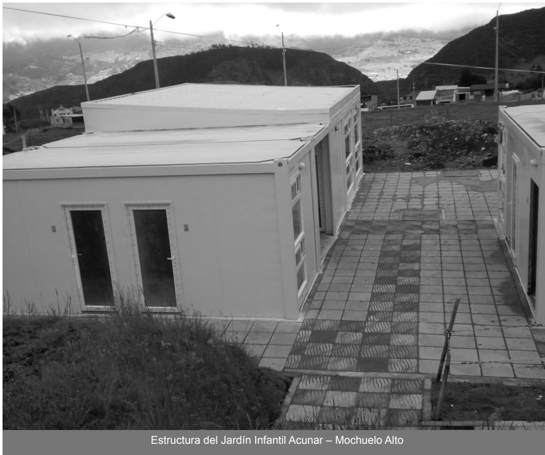
Estructura del Jardín Infantil Acunar – Mochuelo Alto

La atención integral para la primera infancia, continúa siendo prioridad para la Bogotá Humana, por esta razón la Unidad Administrativa Especial de Servicios Públicos, UAESP, dio, en comodato, parte del lote la Isla, ubicado en la vereda Mochuelo Alto, en la localidad de Ciudad Bolívar a la Secretaría Distrital de Integración Social, para construir un nuevo Jardín Acunar. Estos espacios buscan garantizar los derechos a los niños y niñas que viven en lugares retirados, mejorando la calidad de vida, la salud y promoviendo cultura, diversión y acciones pedagógicas.