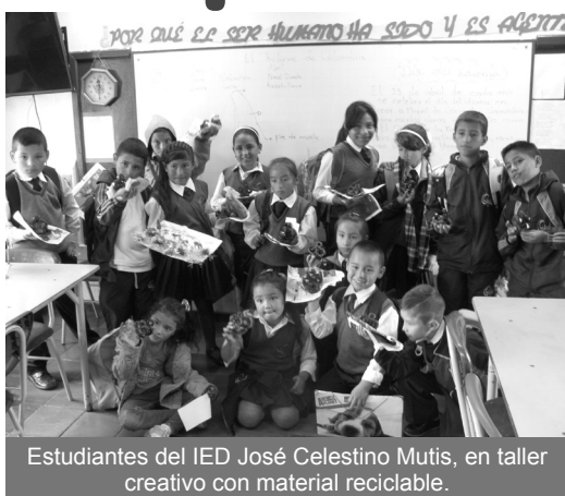
Estudiantes del IED José Celestino Mutis, en taller creativo con material reciclable.

Para los meses de mayo y junio se articularon actividades con estudiantes de las Instituciones Educativas Distritales de Mochuelo Alto y Quiba, sedes A y B, quienes llevaron a cabo talleres de reciclaje, elaboraron artículos como monederos, servilletas, móviles, bandejas y papel artesanal. Mientras que los jóvenes del IED José Celestino Mutis