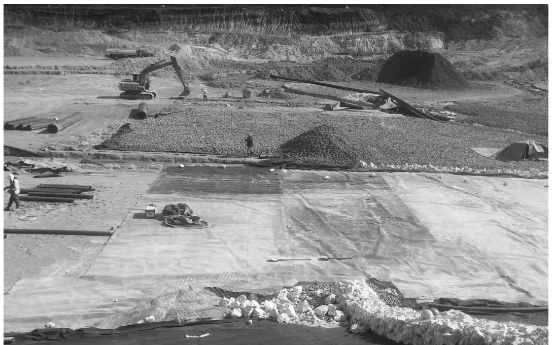
Actividades de adecuación y alistamiento en zona de disposición.

II y zona mansión. Así mismo, fue necesario el lavado de cunetas, canales, cajas de aguas lluvias y la limpieza del sitio destinado al acopio temporal de tierra negra en Zona VIII, se continuó con la rehabilitación de vías operativas del relleno, las cuales conducen al frente de disposición, a fin de garantizar la movilidad interna.