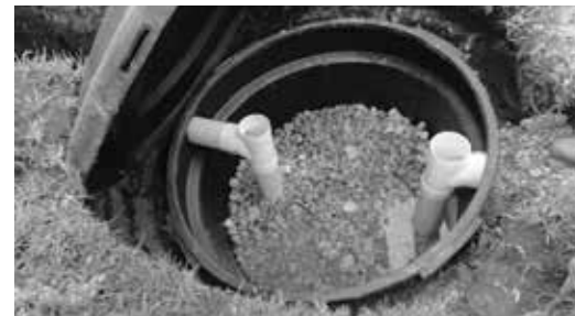
Pozo anaeróbico para el proceso de la planta de tratamiento.

Estos sistemas instalados degradan la materia orgánica contenida en las aguas residuales domésticas y constan de la construcción de una trampa de grasas, que es el sistema que remueve los sólidos mediante la captación y flotación, separando las aguas jabonosas, negras y elementos no biodegradables, un tanque séptico, que sedimenta los sólidos contenidos, los transforma en lodos y gases y el tanque anaeróbico, que tiene la función de descomponer el total de los residuos de la materia orgánica