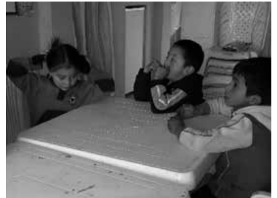
Taller con los niños de Mochuelo Alto desarrollando actividades de memoria.

Para el caso de la vereda Mochuelo Alto, se contó con la participación de 14 niños. Allí tuvo relevancia el tema ambiental; en lo relacionado con el recurso agua, como elemento fundamental para el desarrollo de la naturaleza y su directa relación con la vida humana. Durante la ejecución de estas actividades se logró evidenciar que la población infantil se inquieta por su entorno y la conservación de los recursos naturales y son conscientes de la necesidad de ayudar en beneficio de su comunidad.