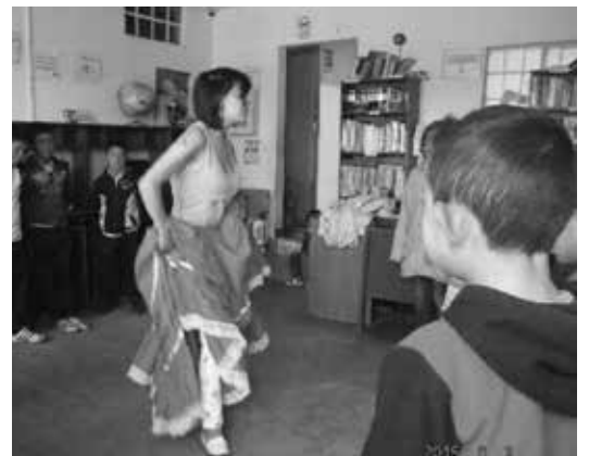
Taller de baile Oficina relaciones con la comunidad de Mochuelo Bajo

Con la participación de 41 niños y niñas de la vereda Mochuelo Bajo, se desarrolló el primer taller de baile, bajo la dirección de una de las integrantes del grupo de danzas de la zona, quien les enseñó la coreografía de uno de los bailes típicos de la zona.