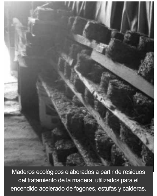
Maderos ecológicos elaborados a partir de residuos del tratamiento de la madera, utilizados para el encendido acelerado de fogones, estufas y calderas.

De igual manera se avanzó en la identificación de experiencias nacionales en el tema de aprovechamiento de restos de comida cocinada (lavazas), concluyendo que estos desperdicios, en la ciudad, se recolectan mezclados con otros residuos crudos, con la ventaja de contar con un bajo contenido de agua. Una vez recogidos se llevan a la planta de tratamiento, donde se tratan con diversas tecnologías; entre ellas la biodigestión; donde el residuo orgánico a transformar a través de la fermentación anaeróbica, para la producción de gas metano y fer-