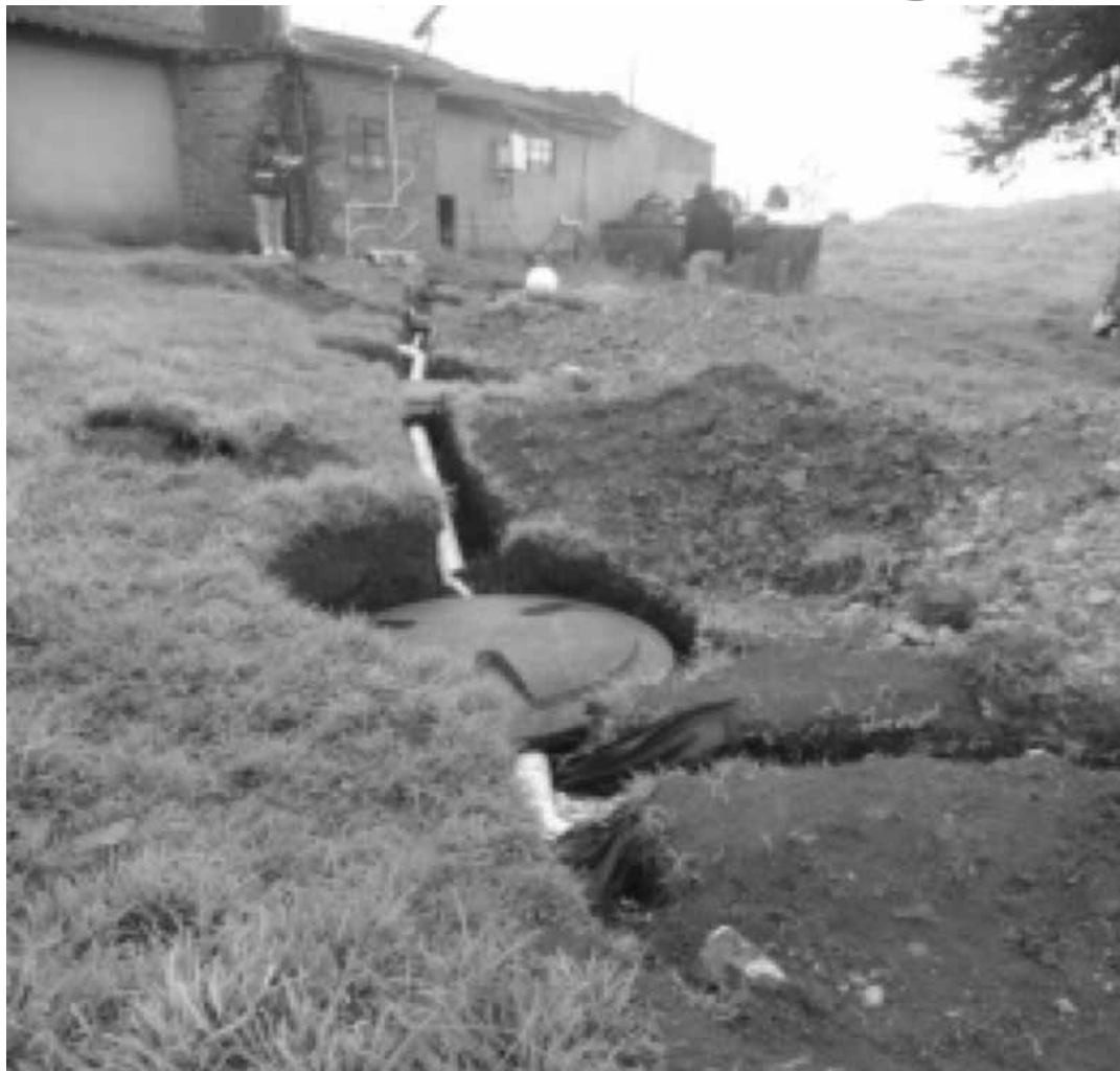
Finca intervenida para la instalación de sistemas eficientes en el manejo de aguas residuales. Mochuelo Alto.

La Unidad Administrativa Especial de Servicios Públicos, UAESP, a través del Convenio Interadministrativo 005 de 2014, tiene como compromiso la construcción de sistemas de tratamiento de aguas residuales, SITAR, en aquellas viviendas cuyos propietarios fueron beneficiados por el subsidio de mejoramiento, a través de la Caja Vivienda Popular de la Secretaría Distrital de Hábitat. Estas actividades se adelantan para satisfacer necesidades básicas identificadas en el servicio de alcantarillado de las veredas Mochuelo Alto y Bajo, población aledaña al Relleno Sanitario Doña Juana, en el marco de la licencia