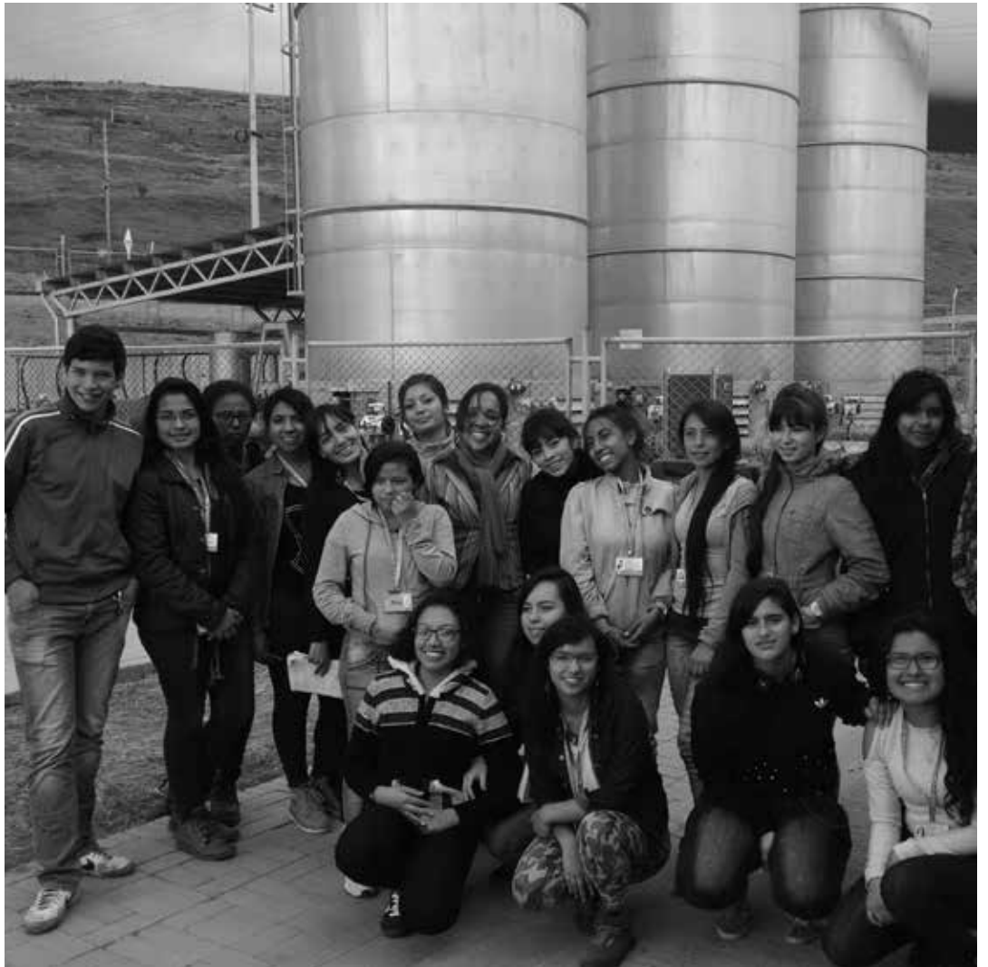
Grupo de estudiantes del Sena visitaron el RSDJ Instalaciones Planta de Biogás. Estudiantes Universidad Militar Nueva Granada

Durante la visita el profesional guía explica la función de cada uno de los sitios y procesos que conforman el relleno; entre ellos área total, delimitación, básculas, conducción y planta de tratamiento de lixiviados, vías internas para la movilidad, señalización, obras de mantenimiento, manejo de aguas lluvias y la ubicación de cada una de las zonas de disposición en los conceptos de cobertura definitiva, empadización y recuperación forestal.