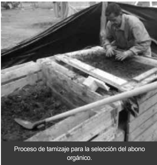
Proceso de tamizaje para la selección del abono orgánico.

Las actividades para el aprovechamiento de residuos sólidos que se adelantan en el marco del Contrato 403 de 2014, entre la Unidad Administrativa Especial de Servicios Públicos, Uaesp y el Consorcio AS, avanzan a buen ritmo, estas, tienen el objeto de orientar y capacitar la viabilidad técnica y ambiental del uso de los residuos sólidos urbanos, entre las comunidades aledañas al Relleno Sanitario Doña Juana, en la localidad de Ciudad Bolívar.