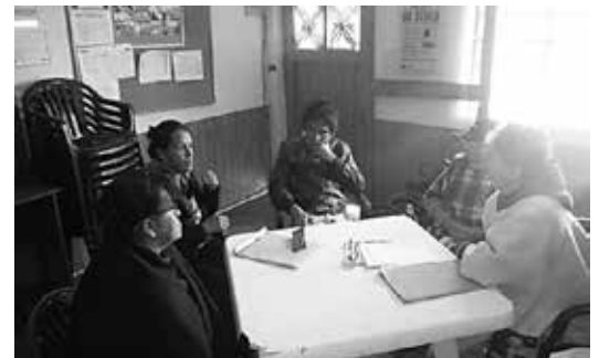
Sesión de trabajo al interior del grupo de Control Social. 2015.

Los ingresos se hacen de manera mensual o cuando el grupo lo solicite, llevan a cabo recorridos por las diferentes zonas;