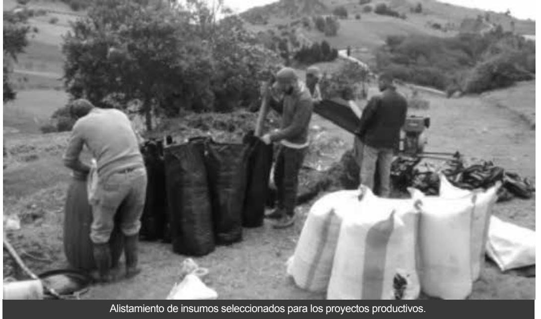
Alistamiento de insumos seleccionados para los proyectos productivos.

En este periodo de tiempo se dio por finalizada la estrategia de sensibilización en la separación de residuos desde su fuente de producción, actividad llevada a cabo en las instalaciones de los colegios de Quiba alto y bajo y en las veredas de Mochuelo alto y bajo, donde se evaluaron los beneficios, resultados y puesta en marcha del ejercicio entre docentes y estudiantes, se avanzó en la consolidación de tres experimentos de aprovechamiento de residuos, incluyendo el análisis de las pruebas de laboratorio para las iniciativas definidas en compostaje, ensilaje y elaboración de maderos ecológicos.