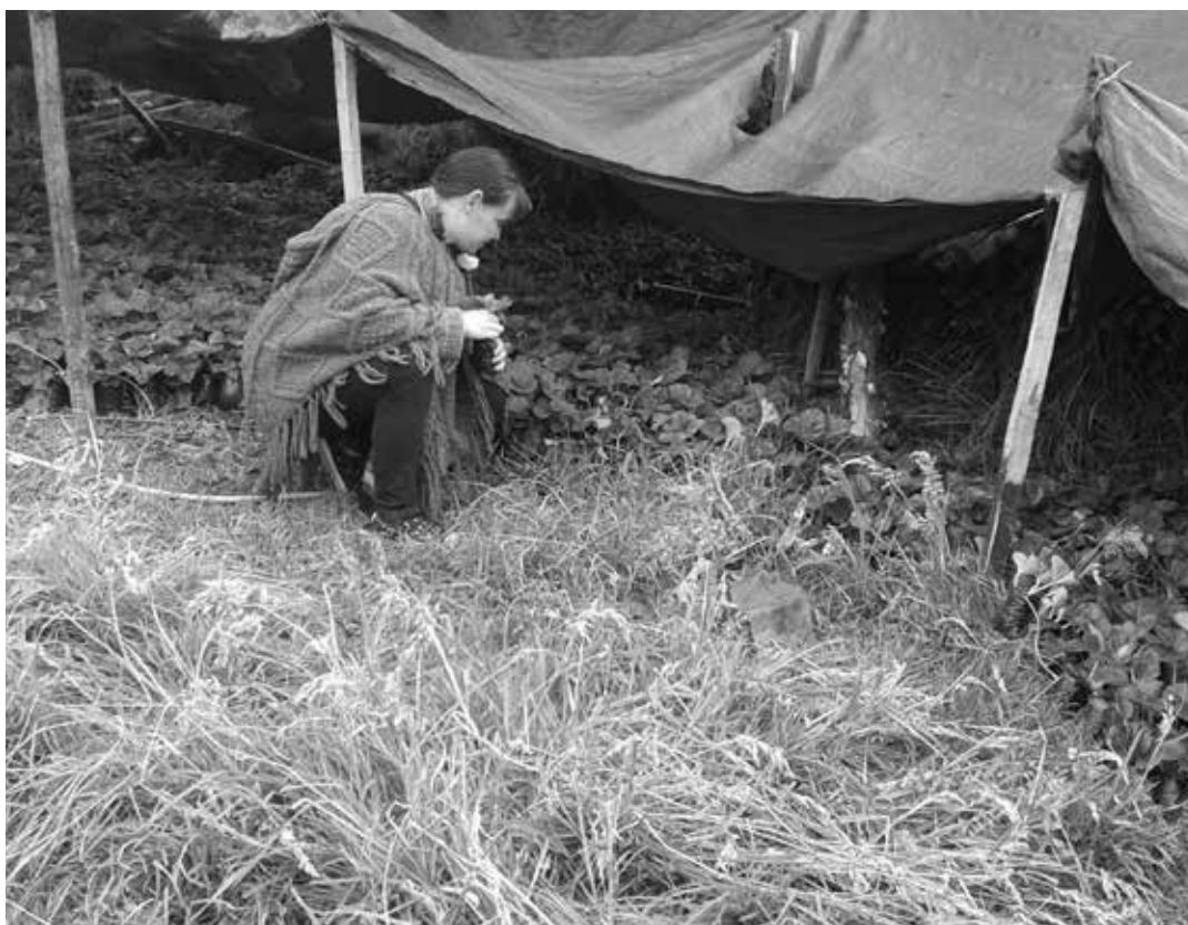
Inspección a semilleros, por parte de los productores agrícolas.

A la fecha se resalta el apoyo y asesoramiento a doce proyectos agrícolas, trece en praderas, dieciocho en iniciativas silvícolas y la entrega de cerca de 2150 árboles, los cuales actuarán en el sector en contra el calentamiento global, como alimento y refugio de insectos y aves, recuperadores del paisaje original y claves para evitar la erosión de suelos.