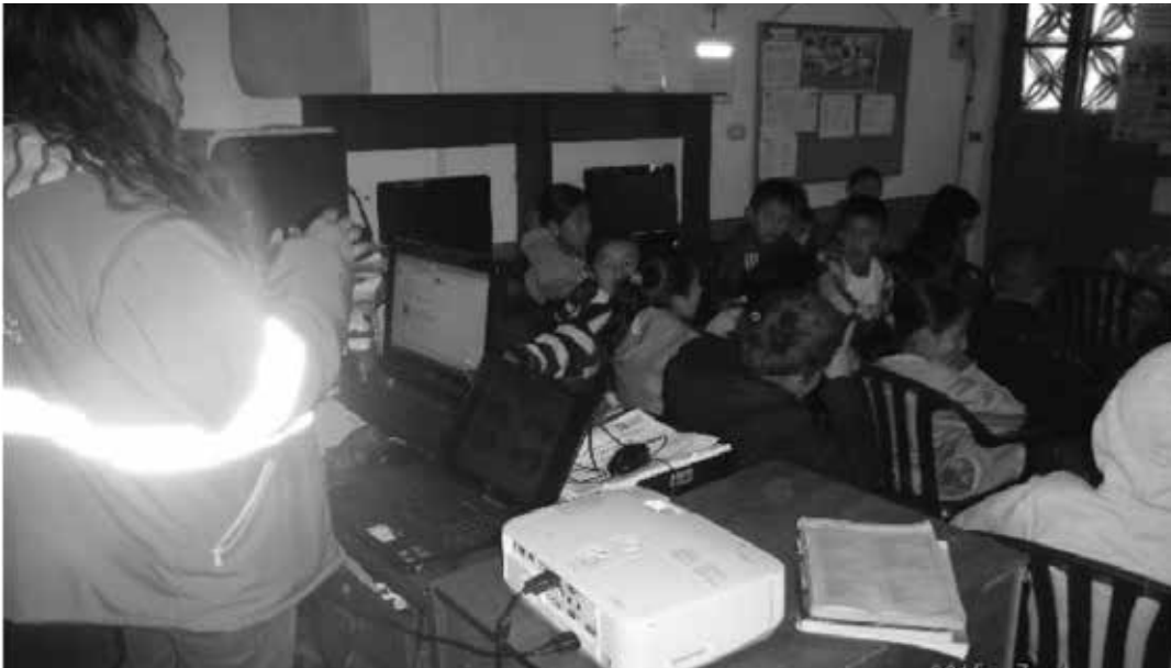
Taller ruta del agua con la profesional social del contrato de alcantarillado en el barrio Barranquitos

Trabajar para los diferentes grupos poblacionales, residentes en la zona de influencia indirecta al relleno sanitario Doña Juana, es de vital importancia para el operador del relleno. Este trabajo se enfoca en actividades relacionadas con la ocupación del tiempo libre, identificación de destrezas y fortalecimiento de las comunidades para encaminarlas a mejorar su calidad de vida.