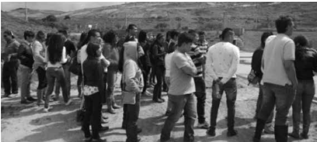
Estudiantes Universidad Militar Nueva Granada

A la fecha cerca de 600 personas han visitado el relleno y han manifestado su agrado por conocer parte de los procesos adelantados por la administración distrital en beneficio del medio ambiente y de la minimización de impactos negativos en la calidad del aire de la ciudad y en la salud de los habitantes en lo que a destino final de residuos se refiere.