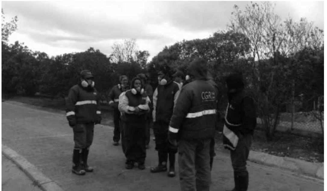
Recorrido del grupo de Control Social, en compañía de delegados de la Uaes, CGR, Doña Juana y de la Interventoría.

Este grupo de personas cumple un proceso de capacitación frente a la responsabilidad de ser participe en el ejercicio del control social y como representantes de la comunidad