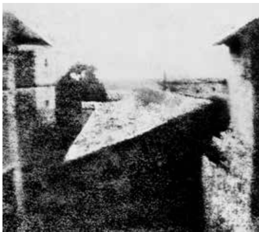
Primera fotografía permanente (Joseph Nicéphore Niépce, 1926)

Han pasado tantas cosas en la historia de la humanidad que al inspeccionar el calendario, encontramos que en todos los días hay algún hito histórico de cierta relevancia: batallas, independencias, revoluciones, descubrimientos, natalicios, fallecimientos, reconocimientos y hasta tragedias inolvidables. Dentro de ellos, hay, también, días amables que pasan desapercibidos y pocos, reconocen o recuerdan. Es el caso del día de la fotografía, celebrado el 19 de agosto. Ese día se conmemora que en 1839 se liberó la primer patente efectiva para que cualquiera pudiese usar la novedosa, pero aún incipiente, tecnología del daguerrotipo, en el que una lámina de plata fotosensible por vapores de yodo podía generar imágenes expuesta a la luz.