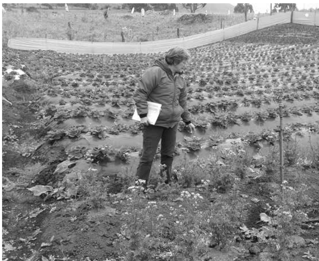
Inspección de cultivos de parte de la UAESP.

A buen ritmo avanzan las actividades contempladas en la primera fase del Contrato 384 de 2014, entre la UAESP y ASODESAM, proyecto cuyo objeto es apoyar las iniciativas productivas, identificadas en los sectores de las veredas Mochuelo Alto y Bajo, en los componentes agrícolas, frutales, renovación de praderas, mejora en la calidad de los pastos, siembra de árboles y entrega de insumos certificados para nuevos cultivos.