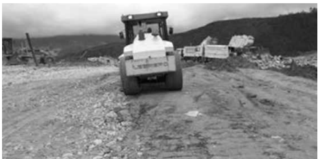
Mantenimiento de vías operativas, compactación de material pétreo

De esta manera se aseguró la recepción del total de los residuos y el tratamiento especial para el destino final de los mismos en el relleno.