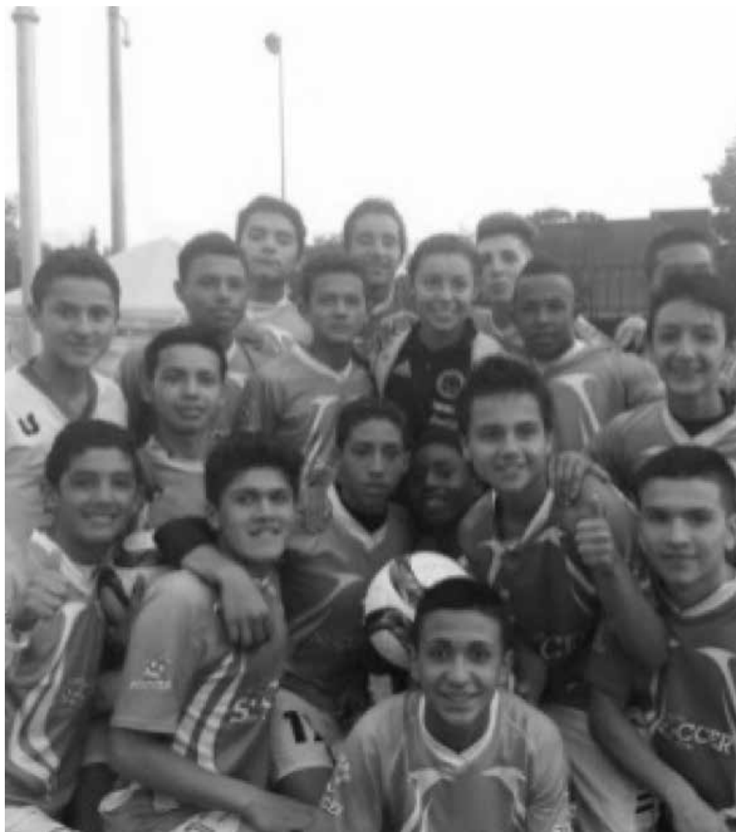
Grupo de jóvenes de la Fundación Superando Retos.

La Fundación Superando Retos, nace en el barrio Mochuelo Bajo de la localidad de Ciudad Bolívar con el objeto de mitigar la segregación social y la desarticulación familiar a través de planes, programas y proyectos a nivel cultural, deportivo, lúdico, medioambiental y de auto sostenibilidad que motiven al ser humano en cualquier etapa de su desarrollo biopsicosocial-cultural.