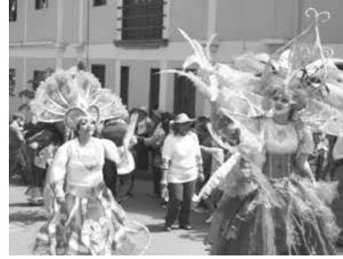
Disfraces coloridos en la celebración del Carnaval de Riosucio, departamento de caldas.

Enero mes que anuncia el año nuevo en gran parte de los países del mundo, tiempo que permite proyecciones y trazabilidad de metas e ideales, algunos de estos eventos invitan a poner en orden las actividades a realizar durante el año con ánimo para dar continuidad a las celebraciones futuras; en nuestro país se resaltan las siguientes festividades: