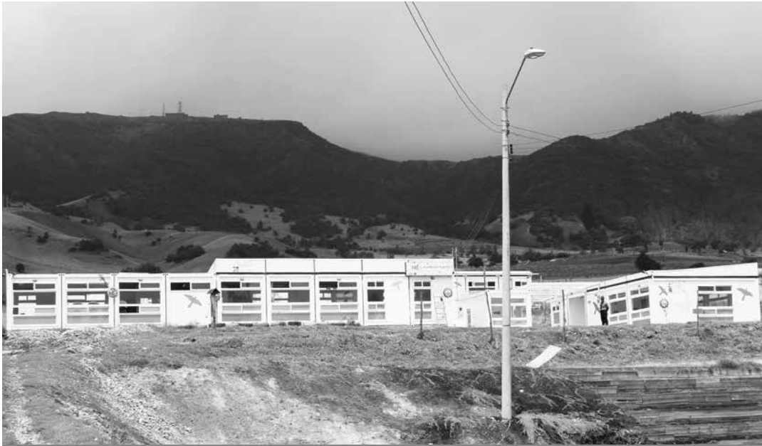
Estructura del Jardín los Alisos de Mochuelo. Ubicado en el sector alto del Predio La Isla. Mochuelo Alto. Enero 30 de 2016.

El Jardín Infantil Los Alisos de Mochuelo, entró en funcionamiento mediante la implementación de dos proyectos de educación; uno de ellos, ámbito institucional, el cual promueve la garantía y restitución de los derechos de los niños y niñas, identificando alertas tempranas, la intervención de su bienestar y el de sus familias, denominado el Jardín Infantil. Así mismo el programa, ámbito rural, denominado Semillas y Agua, el cual mediante talleres, encuentros y visitas domiciliarias identifica el desarrollo integral de los infantes al interior de sus hogares.