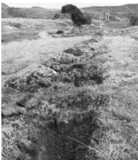
Labores de hoyado para la siembra de especies nativas, en las inmediaciones de la Quebrada el Botello.