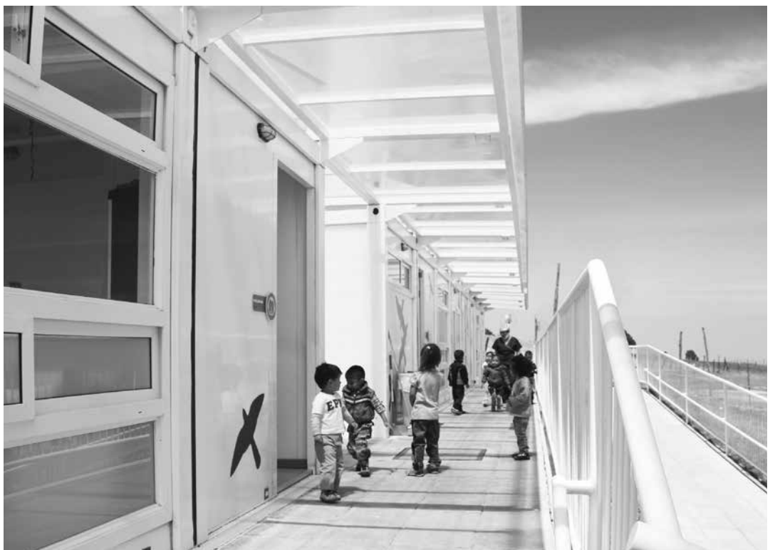
Niños y niñas de los Mochuelos y del sector rural, disfrutaban de las instalaciones y de los programas definidos en beneficio de su desarrollo integral. Febrero 9 de 2016.

Este ejercicio coordinado por la SDIS, pretende trabajar de manera conjunta entre los niños, niñas, familias y comunidad del sector para abordar temas relacionados en mejora de las condiciones de salud, bienestar, rescate de las tradiciones rurales, actividades agrícolas, el respeto a los espacios naturales y el cultivo de una huerta comunitaria, en beneficio directo de la población que reside en este territorio.