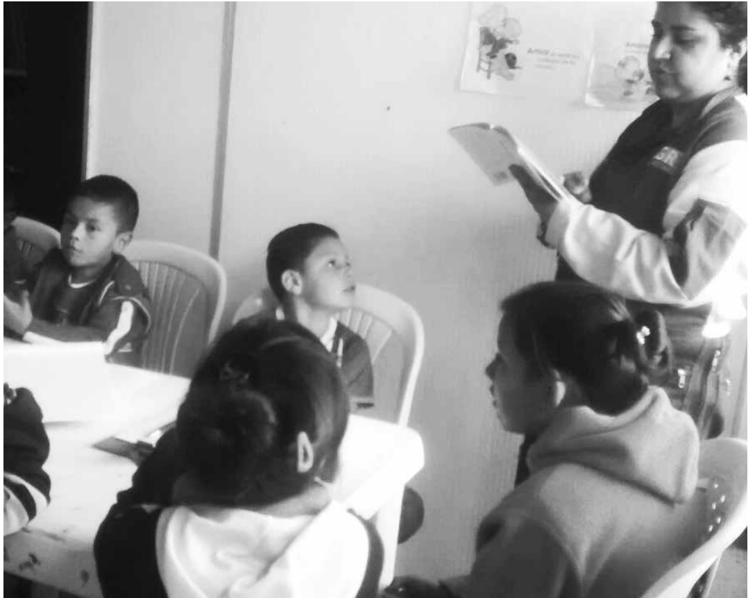
Encuentro infantil guiado por el fascinante mundo de la lectura

La lectura es para las personas una posibilidad de ampliar el conocimiento y los horizontes. Leer nos hace ser mejores, educados, correctos, amables y, sobre todo, solidarios con nuestros se-