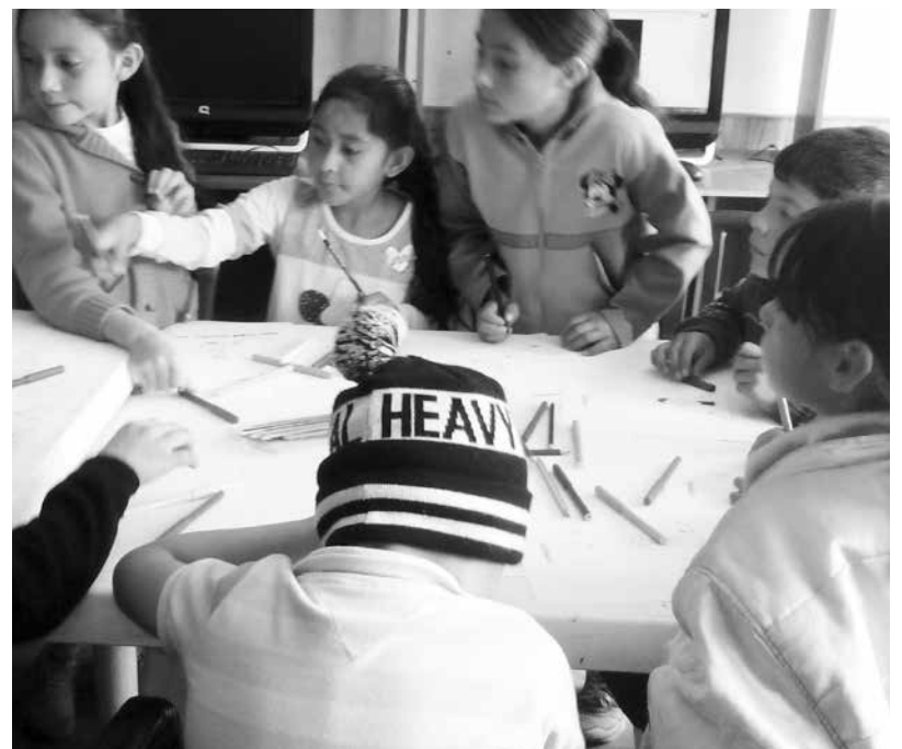
Niños y niñas de Mochuelo Bajo en actividades de coloreado.

este ejercicio se concertaron y evaluaron las actividades con las comunidades a atender con el objeto de definir su efectividad a través de los cronogramas mensuales de trabajo.