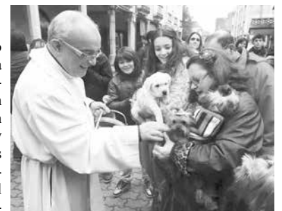
Bendición de los animales en el día de San Antón

El 17 enero se celebra en Abanto, municipio del País Vasco, provincia de Vizcaya, el día de San Antón-San Antonio; ermitaño egipcio y primer monje de la cristiandad, patrón de los animales. Diferentes ciudades se unen a esta festividad mediante un acto central y de eventos en torno a las mascotas como los protagonistas, se bendicen los animales, llevando ofrendas y detalles, que finalizado el evento son rifados entre los asistentes, amenizado por charanga y la degustación de vino tradicional.