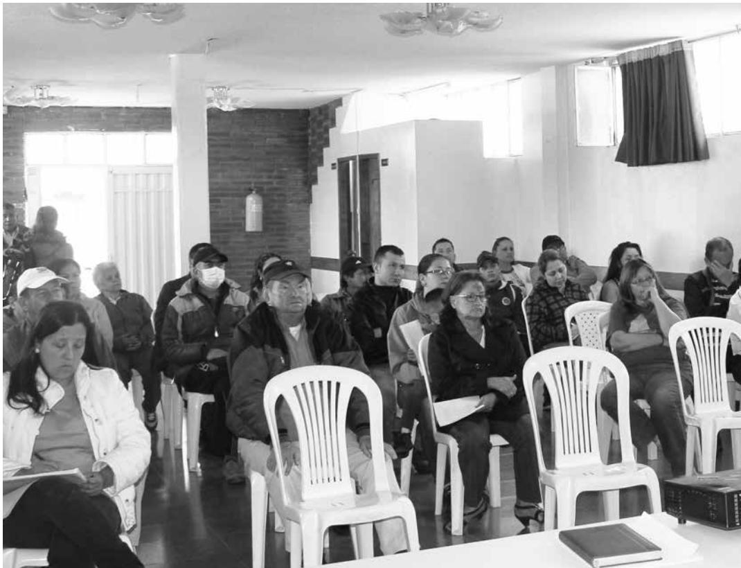
Comunidad residente de la vereda Mochuelo Bajo y los barrios aledaños, atendieron el llamado de Cenasel, para socializar el proyecto y atender las inquietudes de los participantes.

El proceso avanza en la construcción de confianza con las comunidades y los líderes de cada territorio designado por la unidad para el desarrollo de las acciones, los interesados en participar, deben residir en la zona, disponer de un espacio físico, tiempo y excelente nivel de compromiso.