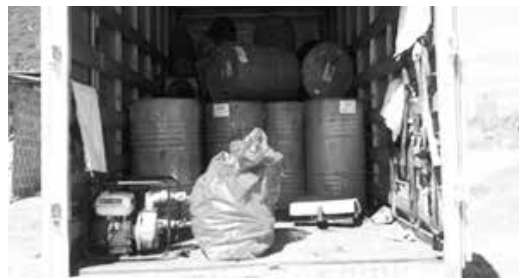
Recolección de residuos peligrosos por parte de gestor autorizado ECOINDUSTRIA en zonas del relleno sanitario.

Como producto de la actividad operativa, es decir: proceso para el tratamiento de lixiviados, mantenimiento de vehículos, maquinaria en el taller, se generan residuos peligrosos, (Respel), los cuales son recolectados por Ecoindustria, gestor autorizado por la autoridad ambiental competente.