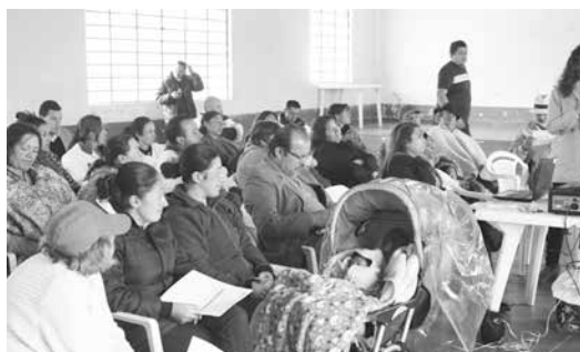
Ser emprendedor es tener visión para innovar. / Página 12