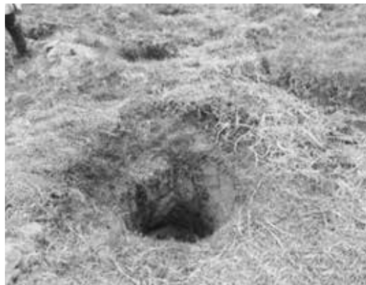
Preparación del terreno para la siembra de árboles sobre la ronda de la quebrada el Botello. Enero 2016.

Con esta actividad, se prepara el terreno para la siembra de árboles sobre las márgenes de rondas de estas corrientes de agua, compensando el componente forestal y paisajístico del Plan de Manejo Ambiental (PMA) de la fase II de Optimización.