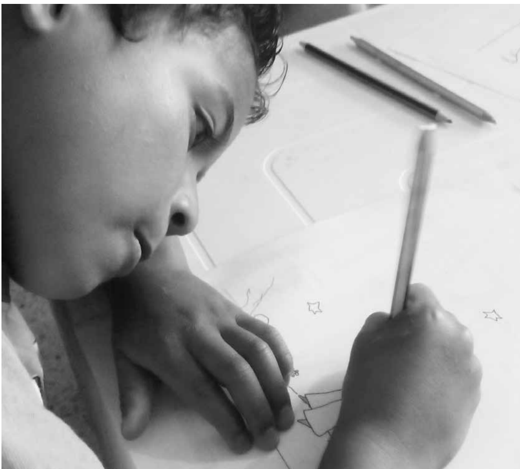
Se enciende la imaginación por medio del dibujo

Invitamos a nuestra comunidad y a sus familias a frecuentar este “rincón”, el cual permitirá definir conceptos sencillos, espontáneos, naturales y abiertos, estará a cargo del equipo de profesionales idóneos del Centro de Gerenciamiento de Residuos Doña Juana.