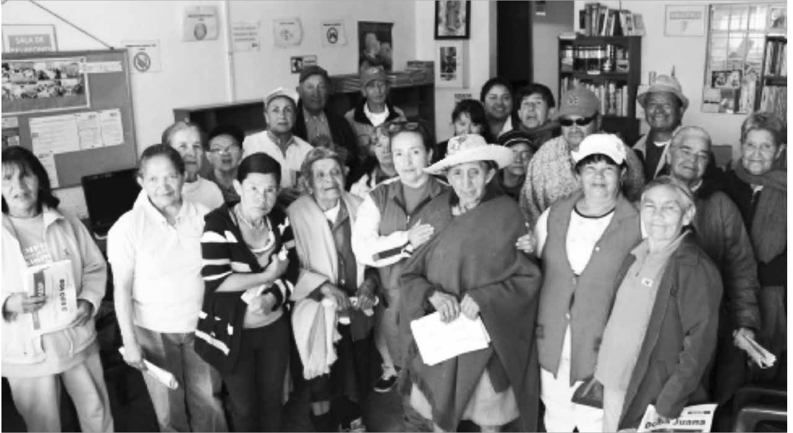
Grupo de Adultos Mayores de Mochuelo Bajo. Enero 26 de 2016.

Promocionar acciones en salud y prevención de las enfermedades entre las comunidades que habitan el territorio son labores que mes a mes proyecta el Operador del relleno sanitario, en este sentido durante los meses de enero y febrero de 2016, se avanzó en el consentimiento del grupo Adulto Mayor, ya formalizado en Mochuelo Bajo y en la definición de los integrantes que día a día se vayan sumando en Mochuelo Alto.