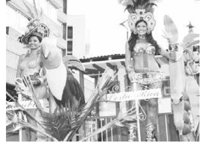
Recorrido de carrozas con las reinas. Municipio de Montería, departamento de Córdoba.