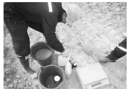
Recolección de muestras de agua al interior de RSDJ.