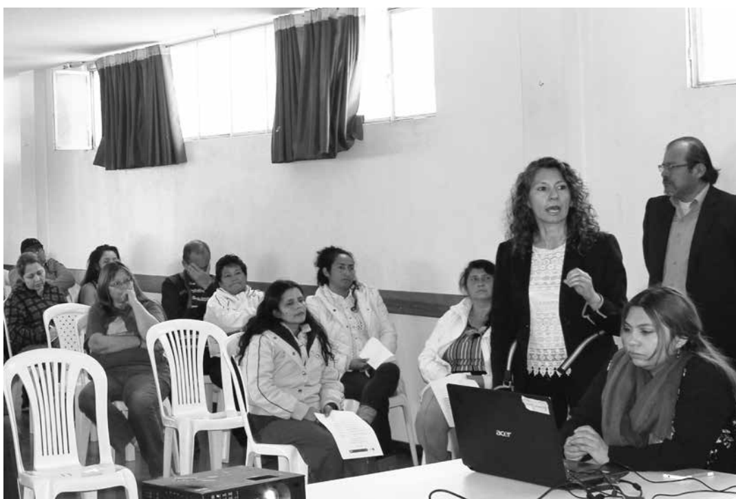
Comunidad residente del barrio Quintas, durante la explicación del programa deportivo. Febrero 9 de 2016.

uso del tiempo libre; dirigido a niños, niñas, jóvenes, adultos y adulto mayor, residentes en la zona de influencia indirecta del relleno sanitario.