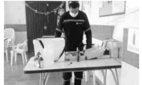
Muestro de agua potable al interior del RSDJ.

Así mismo, en este concepto se lleva a cabo el riego de vías para evitar la generación de material particulado que puede afectar la calidad del aire de la población residente en el sector.