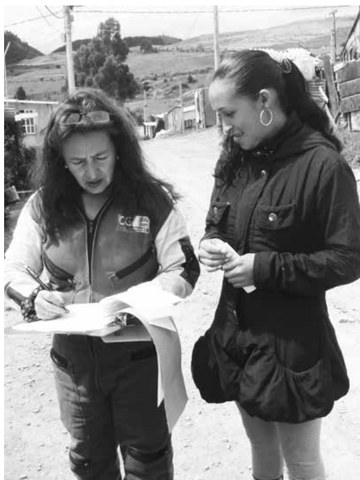
El equipo de Gestión Social del Operador realiza seguimiento de habitabilidad, ingreso y salida de la población que arriba a la zona de influencia.

El Programa de Proyección Poblacional definido para el área de influencia del Relleno Sanitario Doña Juana en el marco de las actividades de la ficha 3.1, realiza seguimiento y registro de las familias que habitan, ingresan y egresan de la zona de influencia indirecta al Relleno Sanitario, es decir las veredas Mochuelo Alto y Bajo, los barrios La Esmeralda, Barranquitos, Patiscos y Lagunitas de la localidad de Ciudad Bolívar. Por ello, se avanza en la actualización de datos de las familias mediante el diligenciamiento semanal del formato de “seguimiento poblacional”. Información que se verifica con el apoyo de los líderes comunales y a través de datos oficiales de las instituciones presentes en el territorio, a fin de conceptuar los motivos de ingreso y salida del territorio, los nacimientos y la defunción de los pobladores.