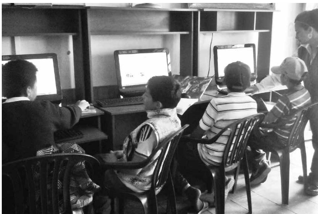
Jóvenes del sector de Mochuelo visitan la Oficina de Relaciones con la Comunidad. Mochuelo Bajo.

El desarrollo de acciones en el concepto del Programa de Información a la Comunidad, propio de la Ficha 3.1., del Plan de Gestión Social, proyecta a través de la Oficina de Relaciones con la Comunidad del Operador del relleno sanitario, el servicio gratuito de internet y de biblioteca, con el objeto de investigar tareas y consultar libros, lo cual tiene como fin incentivar el hábito de la lectura y la investigación.