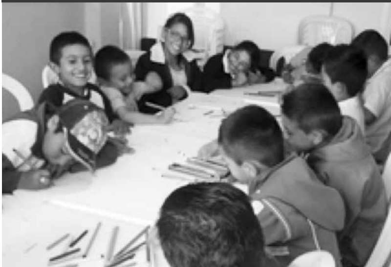
Niños de Mochuelo Alto, en actividad recreativa y de coloreado.

Para el Centro de Gerenciamiento de Residuos Doña Juana comenzar año de actividades es la puesta en marcha de varias acciones en los conceptos técnico, operativo y social. La atención a la comunidad permite evaluar las actividades proyectadas en las fichas de manejo social, en los grupos de los Ciclos vitales, que hacen parte del programa en salud y Medio Ambiente. En