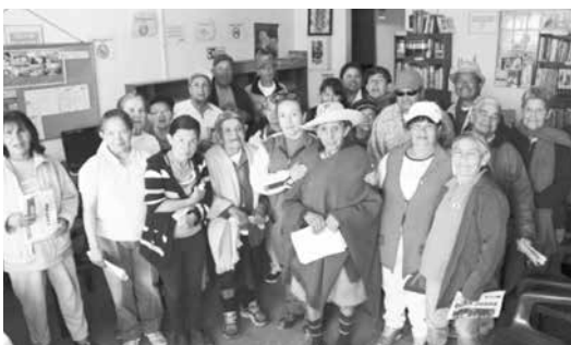
Memoria histórica del territorio Mochuelo Alto. / Página 4