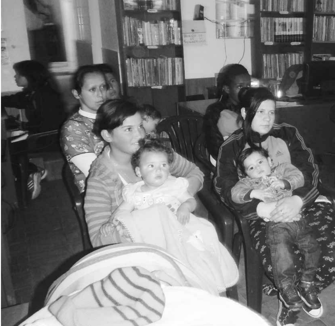
El grupo familiar participa y acompaña el proceso de desarrollo armónico de sus miembros, a través de la cualificación de las relaciones intrafamiliares y el fortalecimiento de vínculos afectivos desde la gestación.

Los Educadores de Familia, es una “modalidad dirigida a niñas y niños desde su gestación, hasta los 2 años y mujeres en periodo de gestación o lactancia y/o al cuidador, para que participen en la crianza de los niñas y niños, esta atención la brindan la madres comunitarias Educadores de Familia, a través de encuentros grupales y visitas en el hogar. En esta modalidad, atiende grupos entre 12 y 15 familias, durante 11 meses del año, los horarios se definen de acuerdo con las necesidades de las familias, en sesiones educativas grupales y en visitas domiciliarias durante 80 horas mensuales.