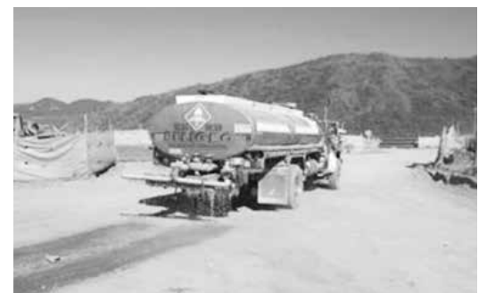
Humectación de vías al interior del relleno sanitario.