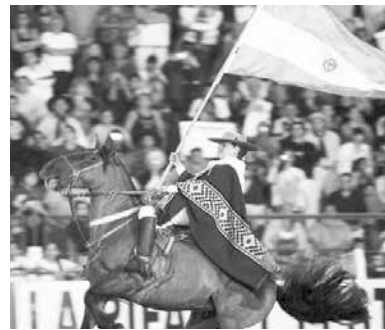
Festival de doma y folclore.

En el municipio de Riosucio del departamento de Caldas, habitaban las tribus Pirsas, Ipa y los Zopia; región bañada por caudalosos ríos, que dieron la fuerza y el colorido a los mata-chines, a la oratoria burlona, a la entrada del demonio, al festejo nocturno y a las comparsas que reflejan un mensaje al ingenio inagotable de sus habitantes y visitantes. Esta celebración presenta dos manifestaciones colectivas el conjuro contra la tristeza y los sentimientos negativos y la alborada, al alegre despertar, a los eventos folclóricos, a las exposiciones y los variados espectáculos.