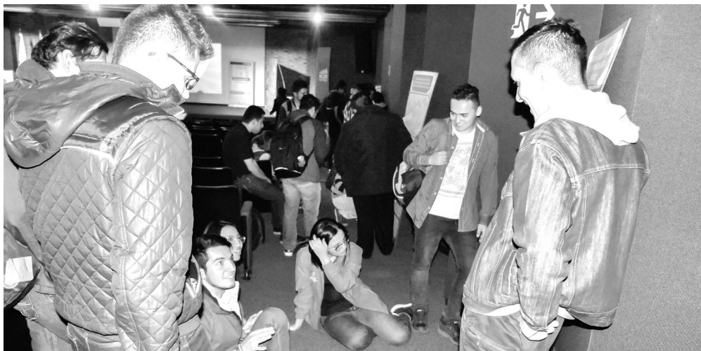
▶ Taller con los estudiantes para definición tema de cátedra de residuos sólidos urbanos.