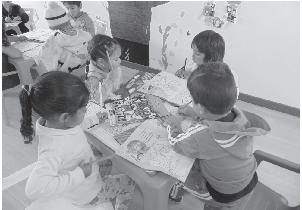
▶ Niños en desarrollo de actividad.

La realización de este taller permitió fortalecer destrezas en los niños a través de la técnica de colorear como la concentración, imaginación, motricidad fina, entre otros, mientras desarrollaron valores como la tolerancia, seguridad, respeto, responsabilidad y el trabajo en equipo.