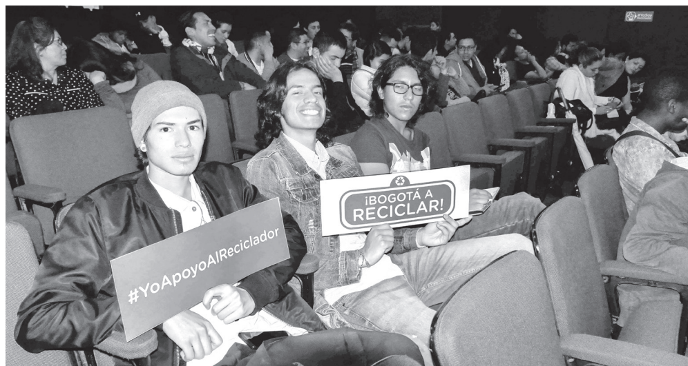
► Promoción acciones PRAS. Foro de Manejo Integral de Residuos Sólidos, Auditorio Alfonso López Pumarejo. Mayo 11 de 2018 Universidad Nacional de Colombia sede Bogotá.

El PRAS que para el ciudadano y los agentes implicados se llamará "Reciclar Transforma", permite la interacción y la armonización entre todos los actores asociados a la gestión integral de residuos sólidos. Desde la definición del esquema operativo de la actividad de aprovechamiento, pasando por la prestación del servicio, metodología tarifaria, incentivos de la separación en la fuente, campañas educativas, la formalización de los recicladores de oficio, llegado hasta la articulación de las cadenas de valor, la dinamización del aprovechamiento y la promoción de la responsabilidad extendida del productor y vendedor. Todo esto teniendo como ejes transversales la gestión del conocimiento, el diseño, la pedagogía, cultura de innovación, comunicación, regulación y gestión de proyectos.