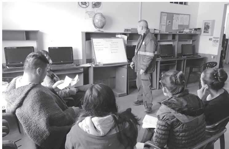
► Capacitación a proyecto Gladiolos y Astromelias de Mochuelo Alto.

Por último se logró aprobar la segunda idea productiva correspondiente al año 2018, la cual tiene como objeto social la confección y elaboración de chaquetas en el barrio Mochuelo Bajo quedando así las dos propuestas a conformar en el presente año 2018.