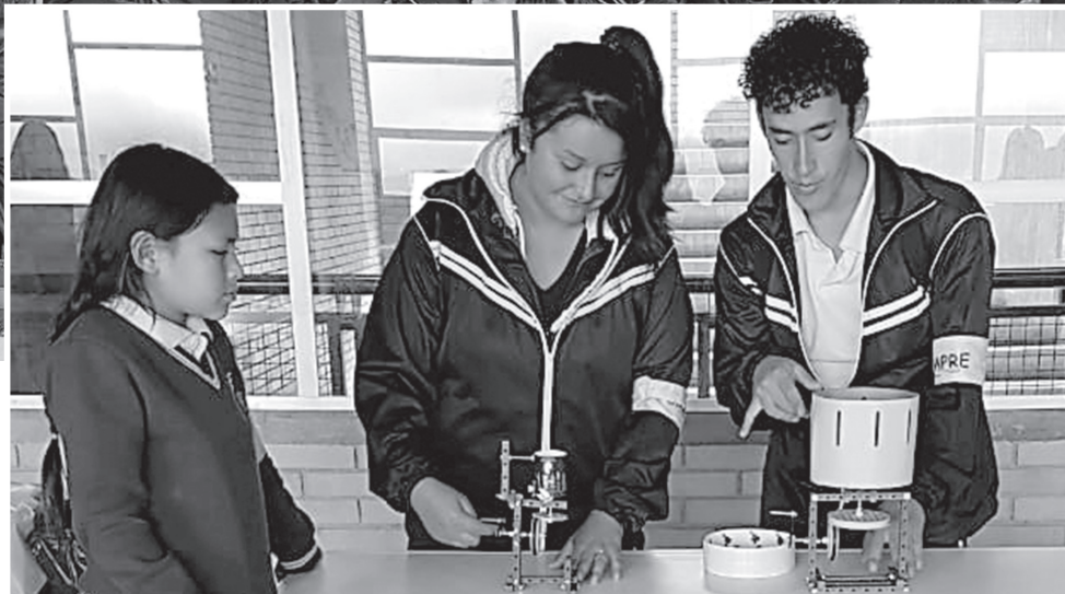
▶ Estudiantes enseñando sus diferentes proyectos.

Por: Claudia Marcela Garrido Floyd Gestión Social CGR-DJ