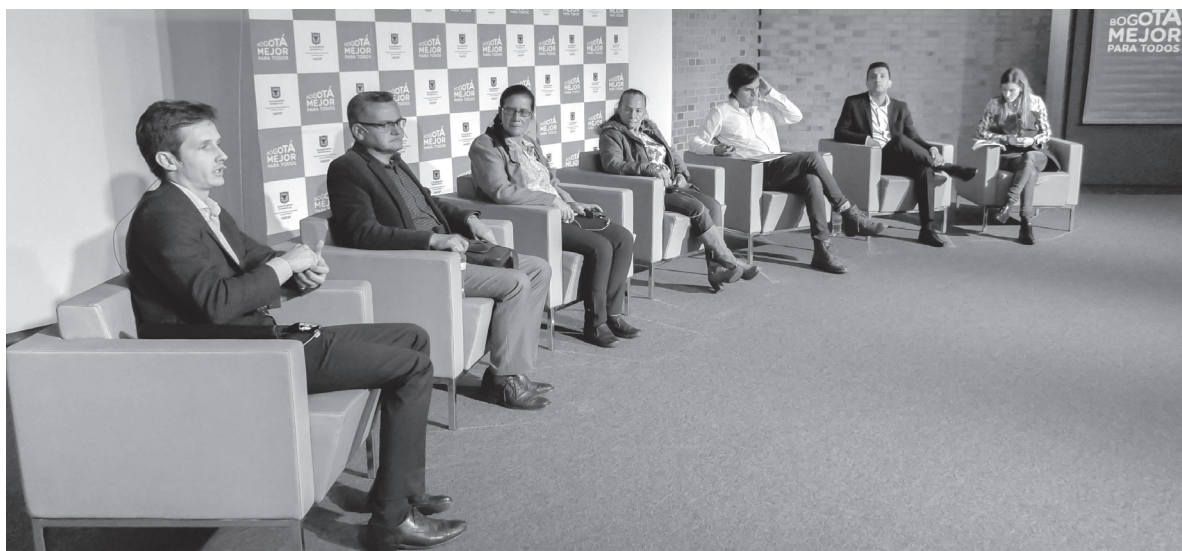
► Panelistas conversatorio del foro, de izquierda a derecha: industrial, académico, representantes organizaciones de recicladores, moderador innovación, representante instituciones como Secretaría de Ambiente y moderadora Disposición Final.

Los representantes de la UAESP explicaron en relación con el nuevo esquema de aseo, los procesos de concientización que se están realizando para educar al ciudadano en el fortalecimiento de la cultura de aprovechamiento de los residuos sólidos, en cómo facilitar y empoderar el oficio de los recicladores (entre ellos con la visión de reforzar la formación de empresa a las organizaciones que se dedican a esta labor), que es una de las tareas que se tiene que cumplir desde la Unidad y las alternativas tecnológicas que se están buscando para el manejo integral de residuos sólidos urbanos y su disposición a mediano y largo plazo.