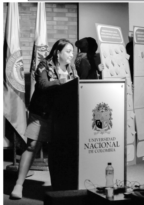
▶ Entrega simbólica de la Cátedra de Manejo Integral de Residuos Urbanos (MIRSU) a la Universidad Nacional.