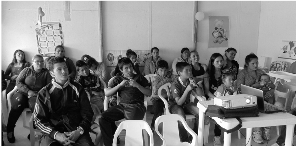
▶ Asistentes a la actividad, Jardín Hogar La Reforma.

Estos espacios son propicios para tratar temas sociales relacionados al fortalecimiento de los lazos familiares para desarrollar las guías de comportamientos que forman las conductas tanto de niños como padres y de esta forma concientizar a los asistentes sobre la importancia del entorno familiar y su influencia emocional en cada uno, con el fin de evitar conflictos que puedan desencadenar en la creación de familias disfuncionales. En esta jornada, las representantes del operador explicaron cada tema, y se realizó la proyección de un video ilustrativo sobre las pautas de crianza para el buen trato, dejando como reflexión las repercusiones existentes debido a las acciones sobre los infantes. Al finalizar los participantes aportan sus conclusiones y se comparte un agradable refrigerio entre los presentes.