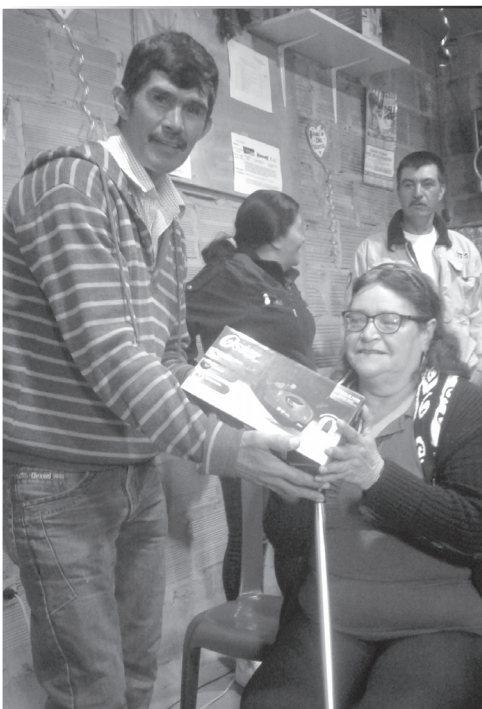
▶ Presidente de la JAC Lagunitas entregando detalles a las asistentes.

Las celebraciones tuvieron lugar el día 20 de mayo de 2018 en el barrio La Esmeralda y el 3 de junio de 2018 en el barrio Lagunitas, el apoyo por parte de CGR-DJ se realizó a través de la donación de un ponqué, gaseosas y el préstamo de la carpa propiedad del proceso de Gestión Social del operador.