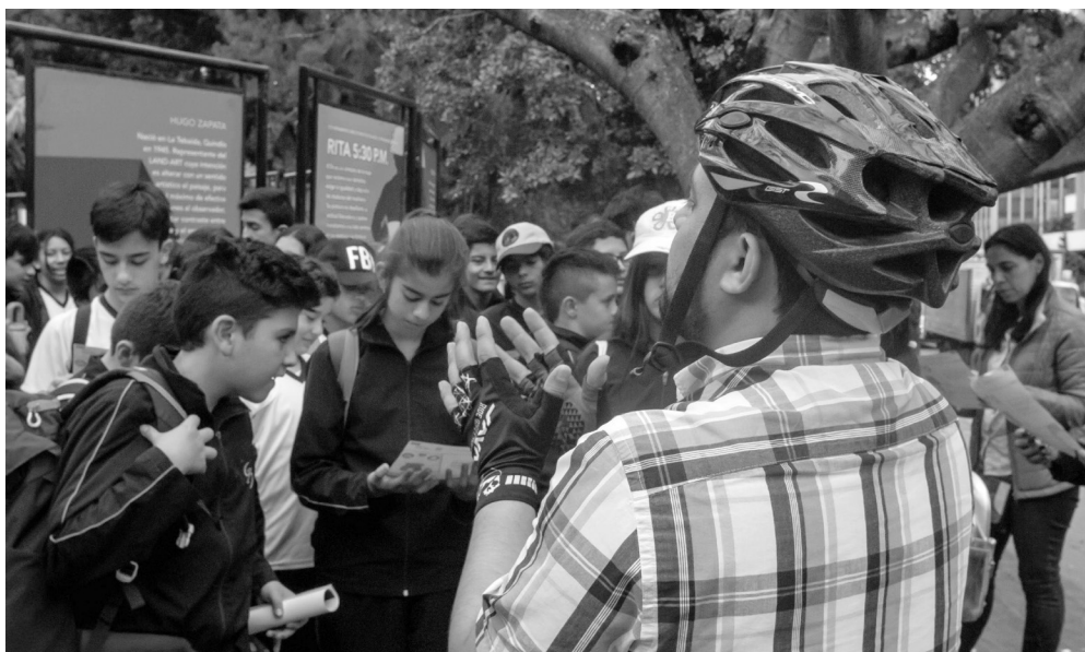
► Miembros de la UAESP explicándole a estudiantes sobre la importancia del reciclaje.

Fueron numerosas actividades, todas centradas en un único objetivo, crear conciencia por el cuidado de nuestro medio ambiente, generando comportamientos que permitan desde la más mínima acción, generar una contribución para preservar nuestro ecosistema y combatir contra el cambio climático.