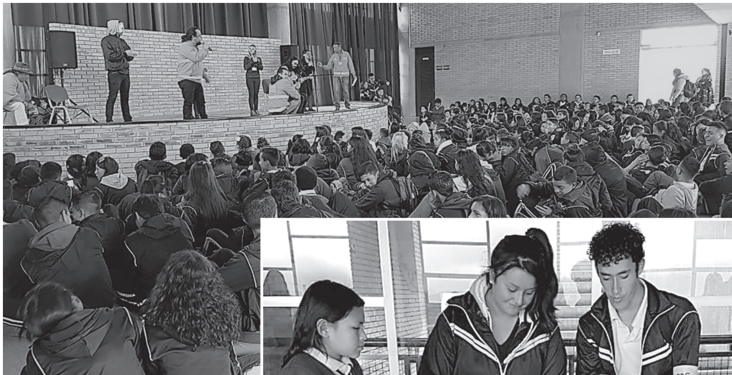
▶ Estudiantes del Colegio Distrital José Celestino Mutis en el desarrollo de las diferentes actividades.