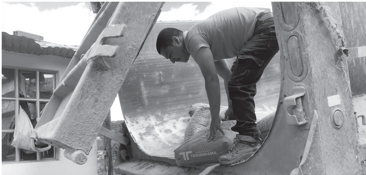
► Entrega de materiales proyecto Bio Clean, Rincón de Mochuelo.