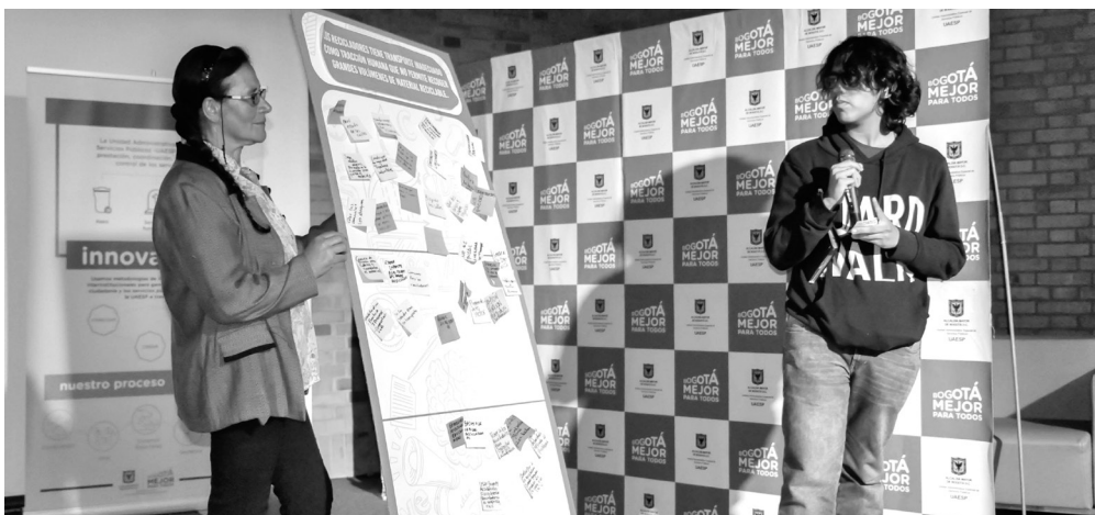
▶ Presentación resultados por parte de los estudiantes al público en general.