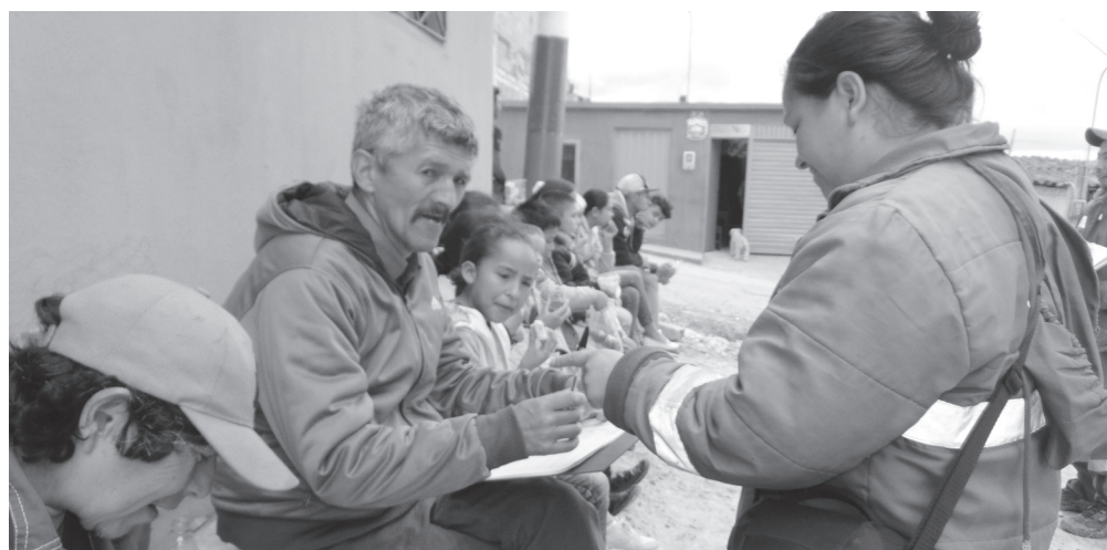
► Asistentes a la actividad de separación en la fuente, barrio La Esmeralda.

Por parte del operador CGR Doña Juana se invita a la comunidad a que sean parte de estas capacitaciones con el objetivo de crear conciencia en los habitantes del sector y mejorar las condiciones de vida de cada uno.