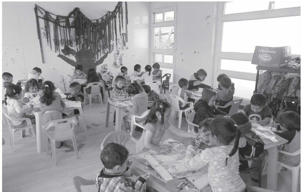
▶ Niños pertenecientes al Jardín Aliso del Mochuelo durante el desarrollo de la actividad.