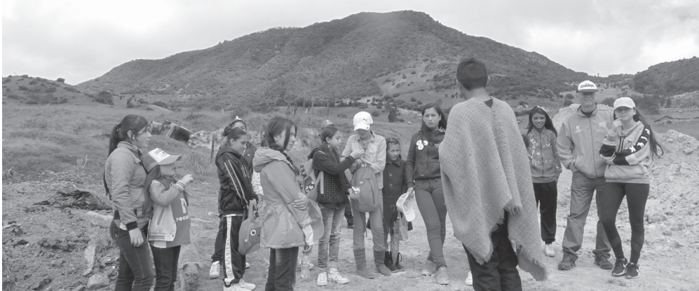
► Voluntarios Semilla durante el recorrido ambiental.