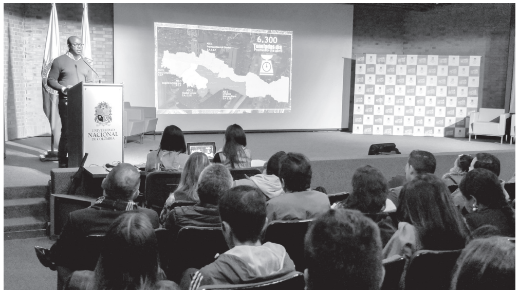
► Presentación nuevo esquema de aseo subdirección de RBL-UAESP.