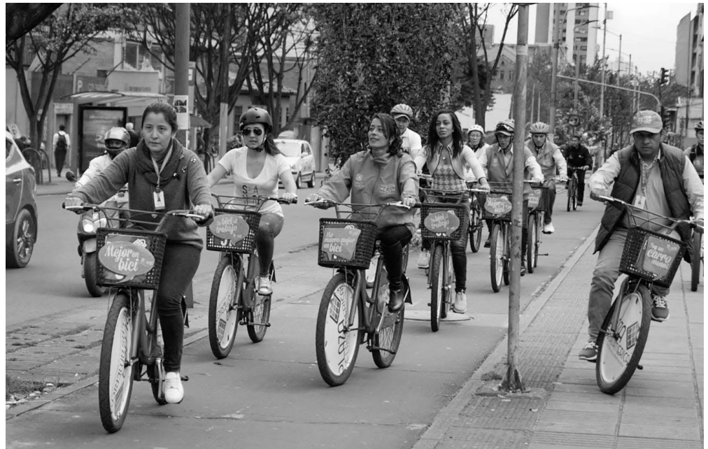
► Jornada de Bici paseo con funcionarios de la UAESP.

Otro momento importante sin duda fue la participación de los recicladores, quienes en esta ocasión fueron los responsables de realizar charlas y talleres a los miembros del Distrito, especialmente la Secretaría de Movilidad, la Secretaría General de la Alcaldía Mayor de Bogotá y la Alcaldía local de Tunjuelito, quienes aprendieron sobre la importancia de realizar un consumo responsable en donde se comprometieron con las