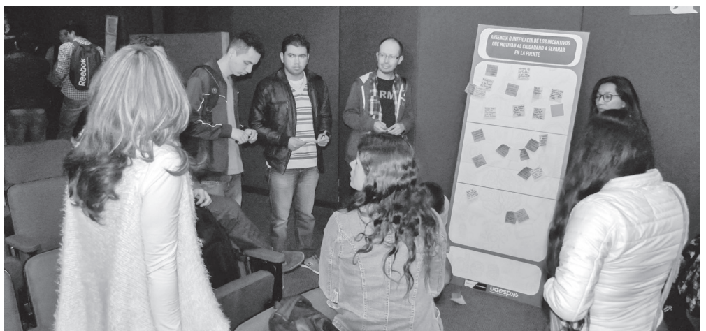
► Taller de co-creación con los estudiantes de las universidades públicas.

Este evento se cerró con un taller de co-creación con los asistentes en donde se buscó identificar los intereses de los jóvenes para la construcción de una cátedra sobre el Manejo Integral de Residuos, partiendo de los intereses de las nuevas generaciones y de las problemáticas que entre grupos pudieron identificar.