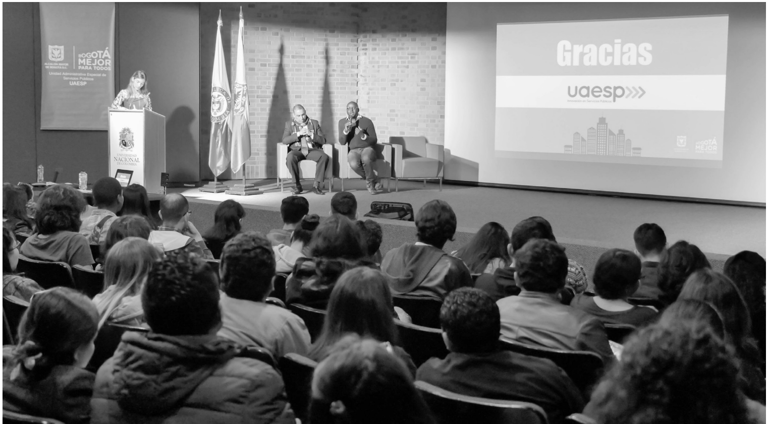
► Presentación Plan de Acción para el aprovechamiento de residuos sólidos y fortalecimiento a las organizaciones de recicladores subdirección de Aprovechamiento-UAESP.

Un evento para que los estudiantes de las universidades públicas de Bogotá conozcan los diferentes puntos de vista para el manejo integral de residuos y sus formas de participar como ciudadanos habitantes de la capital.