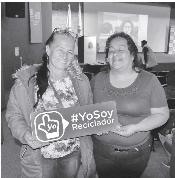
► Dignificación de los recicladores. Acciones del PRAS.