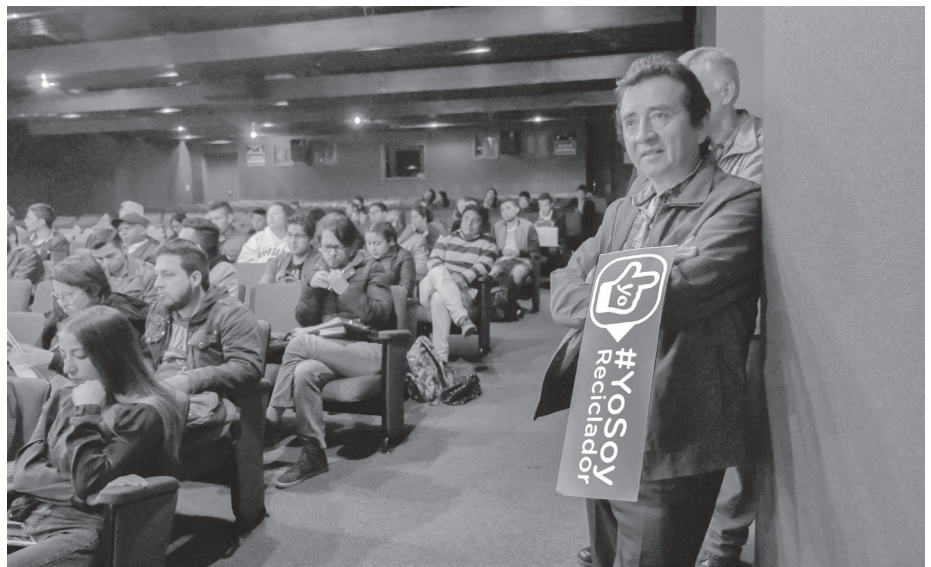
► Socialización con los asistentes acciones PRAS.

En este orden de ideas, el PRAS o Reciclar Transforma establece siete (6) líneas de acción: