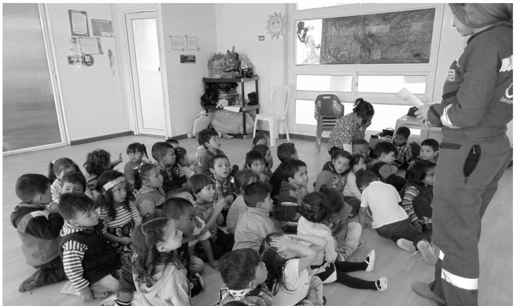
▶ Actividad hábitos saludables en niños, Jardín Aliso del Mochuelo.