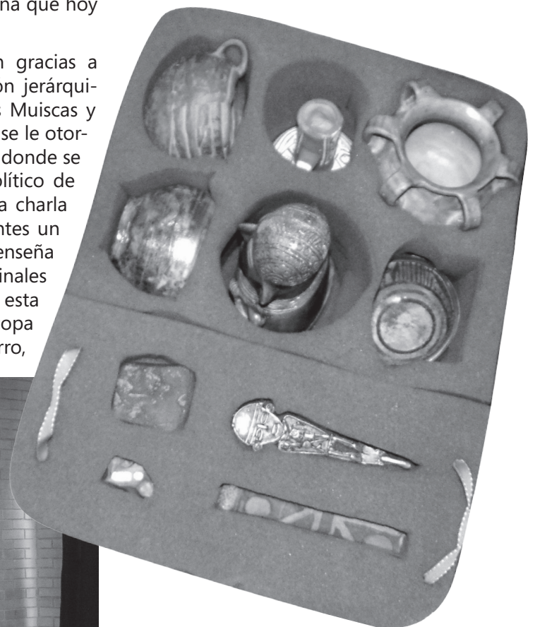
▶ Piezas arqueológicas (réplicas y reales) de la cultura Muisca enseñadas a los estudiantes.