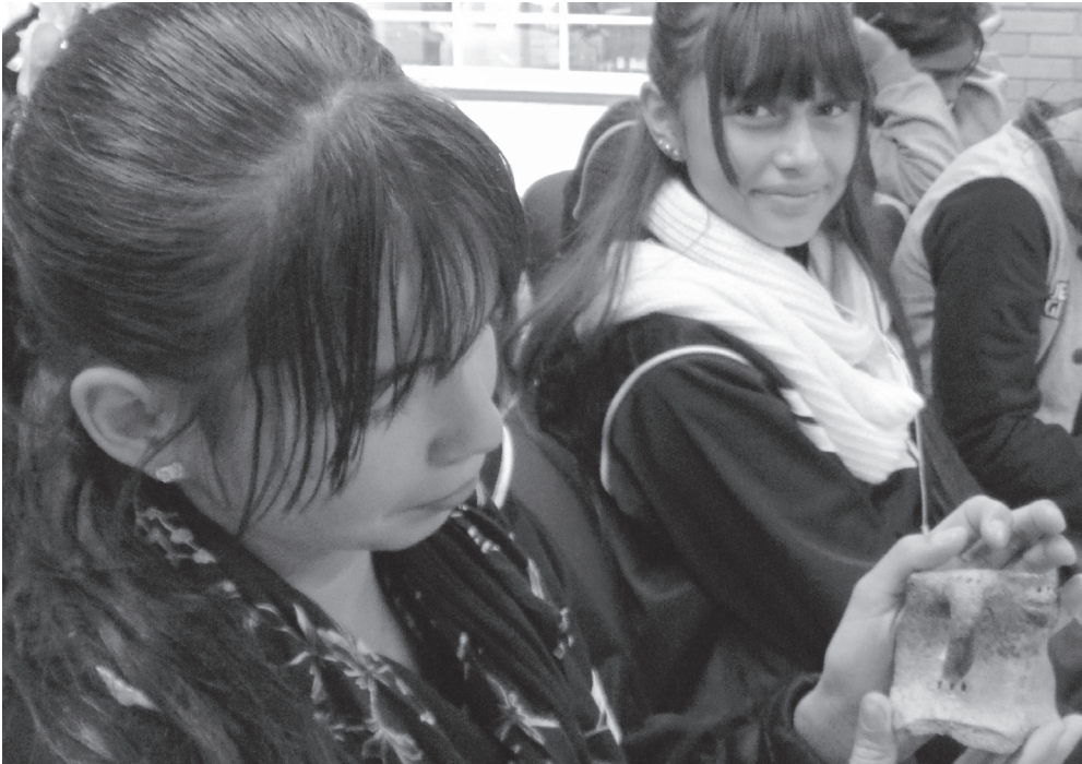
▶ Estudiantes del Colegio Distrital José Celestino Mutis que hicieron parte de la capacitación en arqueología.

Por: Claudia Marcela Garrido Floyd Gestión Social CGR-DJ