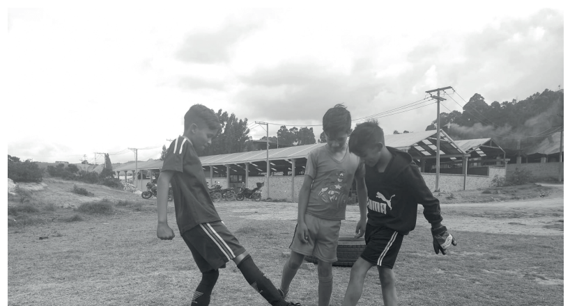
» El equipo realiza sus entrenamientos en un lote ubicado en La Pradera.