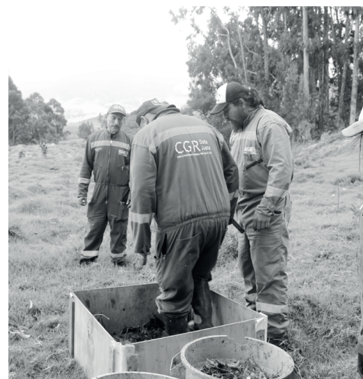
» Elaboración de paca digestora, actividad promovida por la organización de recicladores Sineambore.