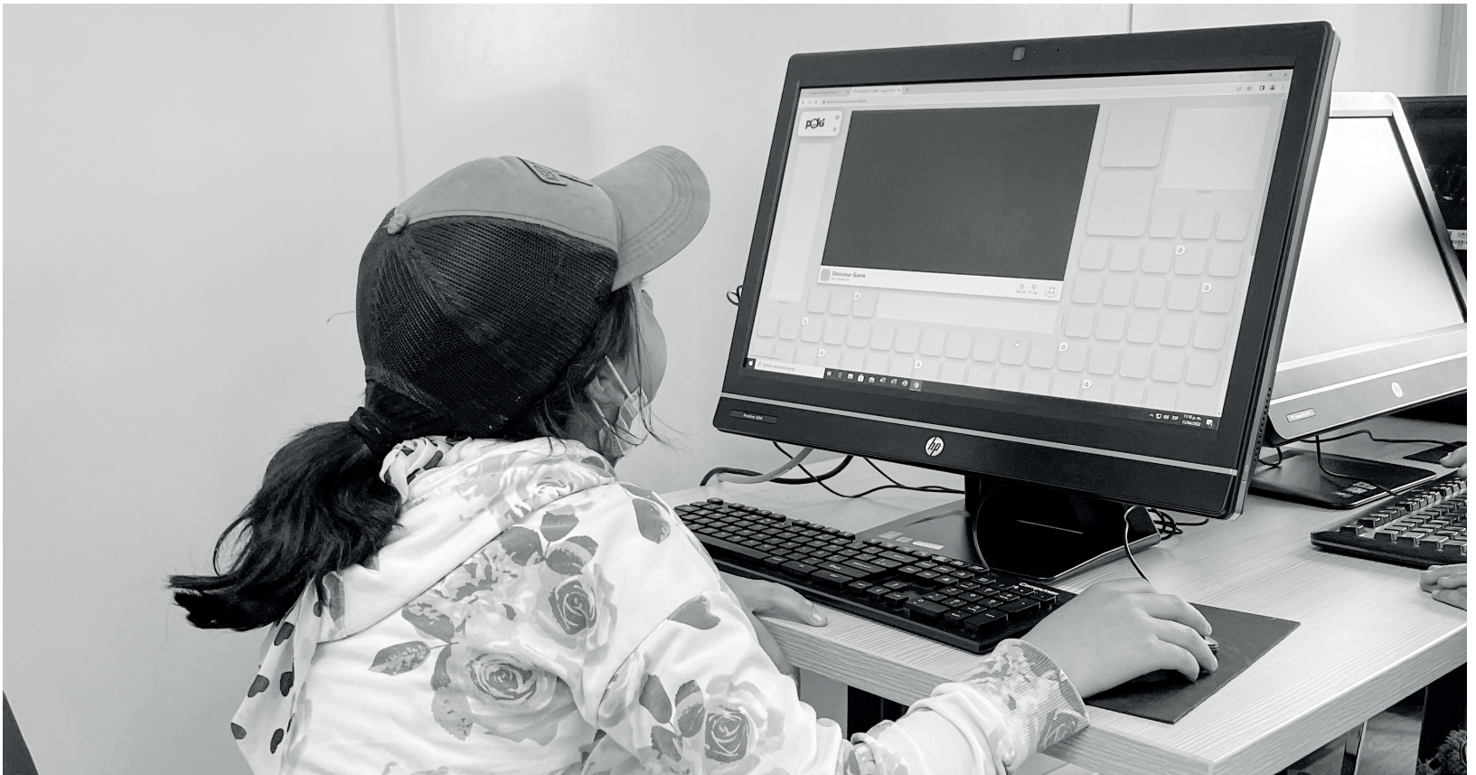
» Jóvenes y adultos podrán acceder a cursos complementarios en el Nodo Digital de Mochuelo Alto.

El Nodo Digital de Mochuelo Alto operará de lunes a viernes, de 8:00 a.m. a 4:30 p.m., en el Centro Multipropósito.