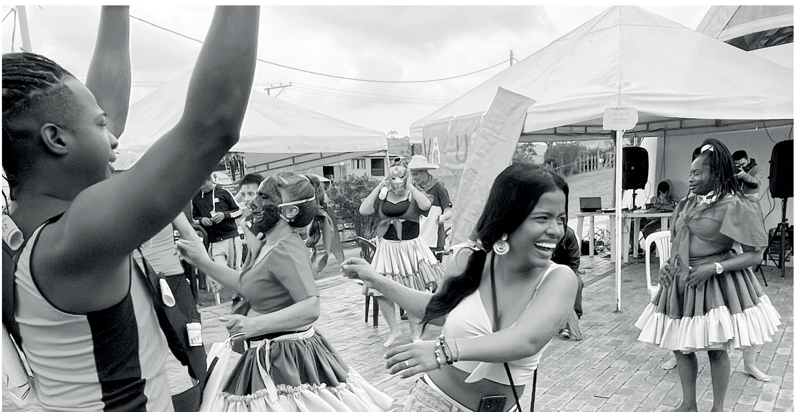
» Hubo actividades artísticas para pequeños y grandes.