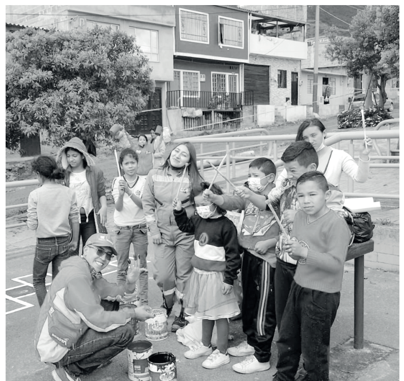
» Niños y niñas hicieron parte del ciclo experiencial a través de la pintura.