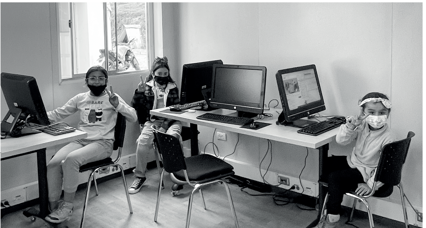
» Niñas de Mochuelo Alto navegan en internet en el Nodo Digital de la UAESP.