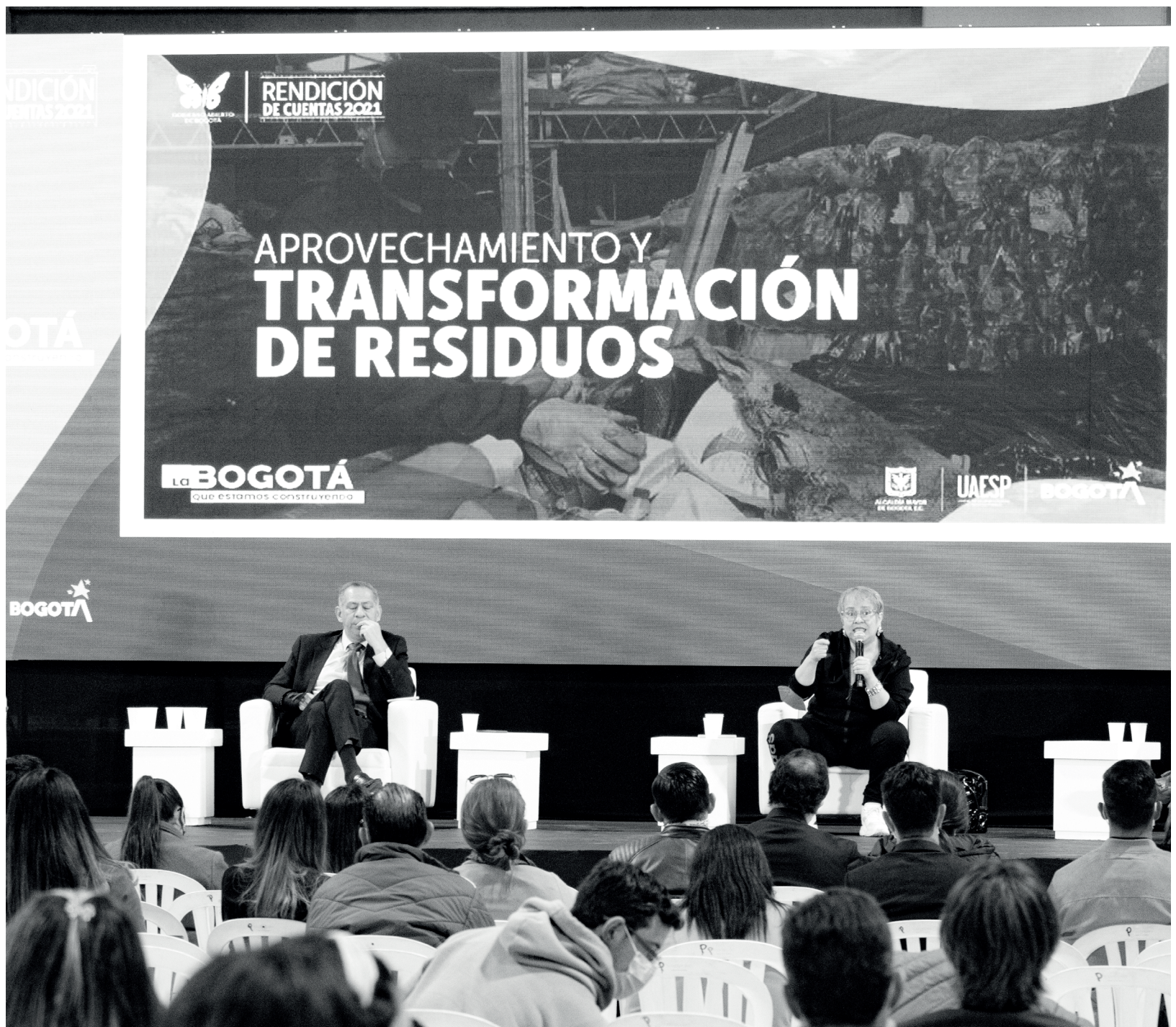
» La Audiencia Pública de Rendición de Cuentas de la UAESP se realizó el 31 de marzo en el Palacio de los Deportes.

En esta área de 700 hectáreas habrá plantas de termovalorización de residuos sólidos, plantas de aprovechamiento de plásticos, residuos orgánicos y desechos de demolición y construcción, una planta de biogás, procesos tradicionales de enterramiento y un área de restauración ambiental.