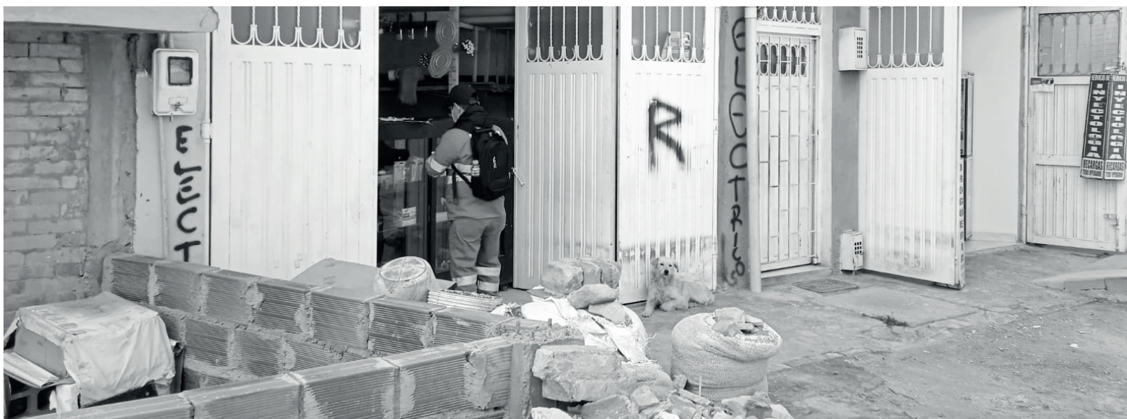
» Los comerciantes también deben ser aliados en la gestión de residuos.

Cuando manejamos correctamente los residuos, se reducen costos de gestión de riesgos por inundaciones, deslizamientos, contaminación, deterioro del paisaje, entre otros.