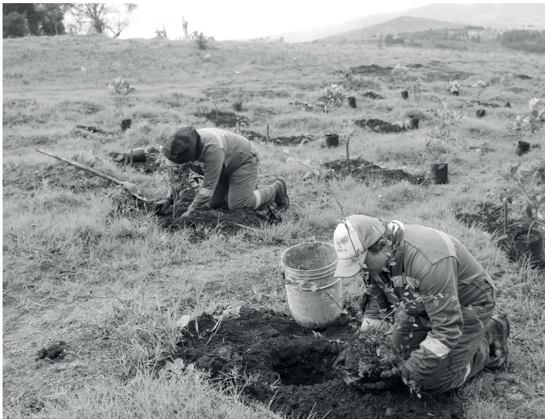
» Las jornadas de siembra son los espacios propicios para el empoderamiento del territorio y la sostenibilidad.

Esta siembra hace parte de las tareas de cumplimiento de la compensación del proyecto de optimización Fase 2: