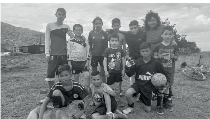
» Equipo “Unión Tere” de Rincón de Mochuelo.