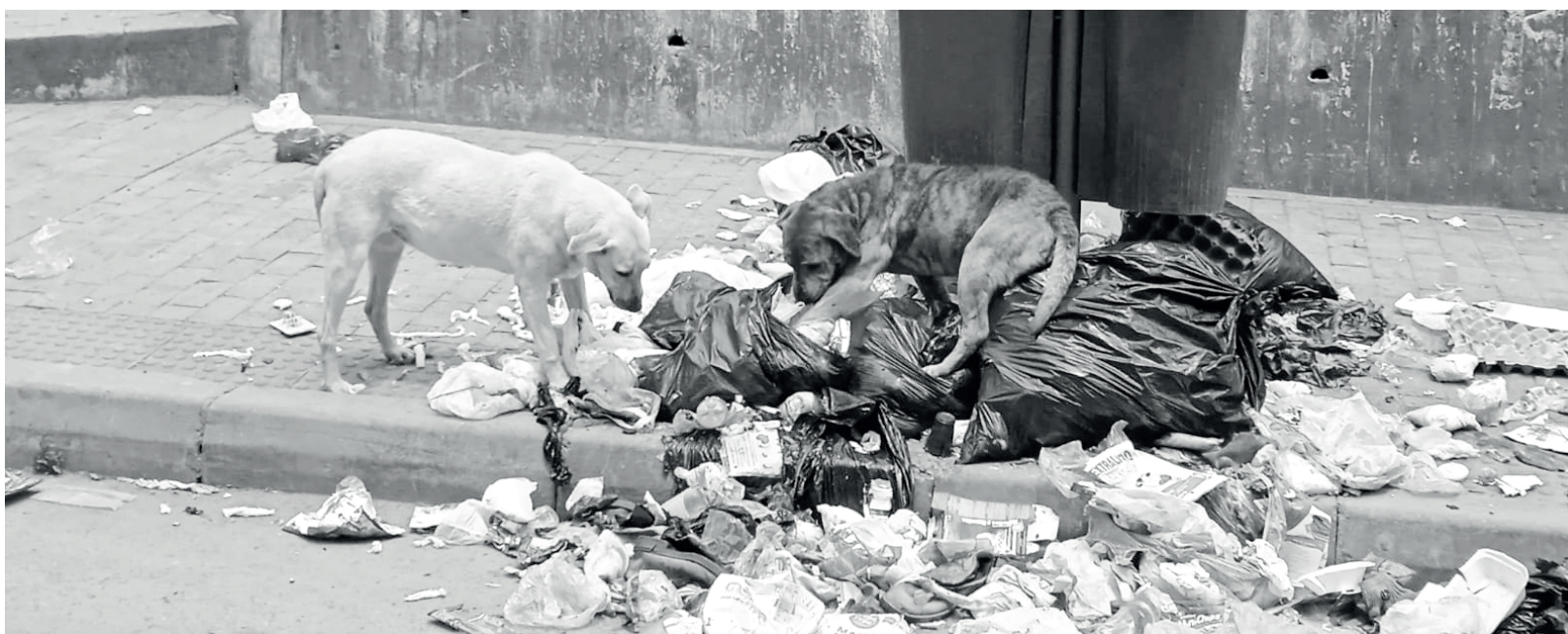
» La inadecuada gestión de los residuos genera puntos críticos.

Hemos atendido las quejas, reclamos y solicitudes, no solo de líderes de las Juntas de Acción Comunal, sino también de los representantes de fundaciones, comerciantes, residentes, comunidad en general de Los Mochuelos respecto al servicio del operador de aseo LIME. Esto nos ha permitido llegar a otros frentes como en el caso de las mejoras en vías urbanas y rurales de los barrios Barranquitos y Paticos,