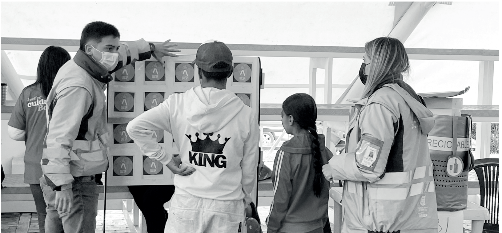
» La UAESP sensibilizó a la ciudadanía sobre gestión adecuada de residuos.

la UAESP y a los canales del equipo de gestión social de la entidad con la comunidad de Los Mochuelos.