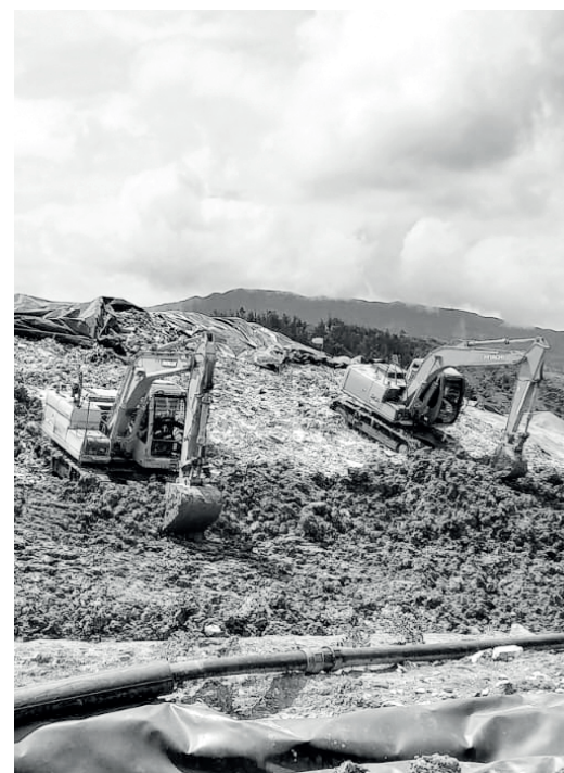
» Cobertura en arcilla.

A pesar de las condiciones anteriormente mencionadas, CGR dio continuidad a los controles establecidos para la mitigación de los impactos ambientales sobre la comunidad.