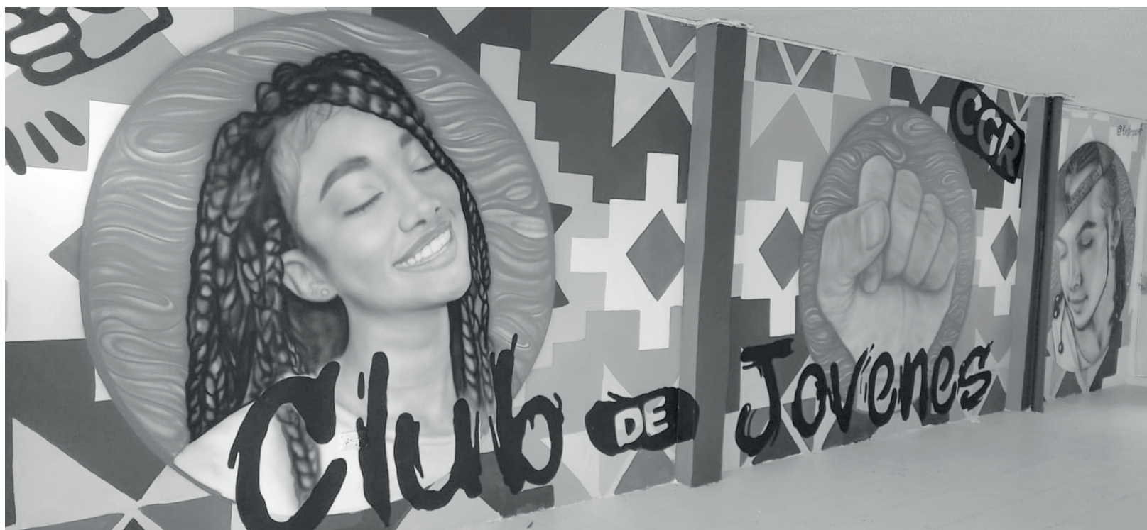
» Mural Casa Club de Jóvenes CGR.

El ingreso de todos los asistentes fue recibido por el gran mural, realizado por los representantes de Monster-Paint, jóvenes que a través de la pintura quieren expresar los sentimientos comunitarios. Esta obra tuvo el apoyo de jóvenes que hacen parte del club.