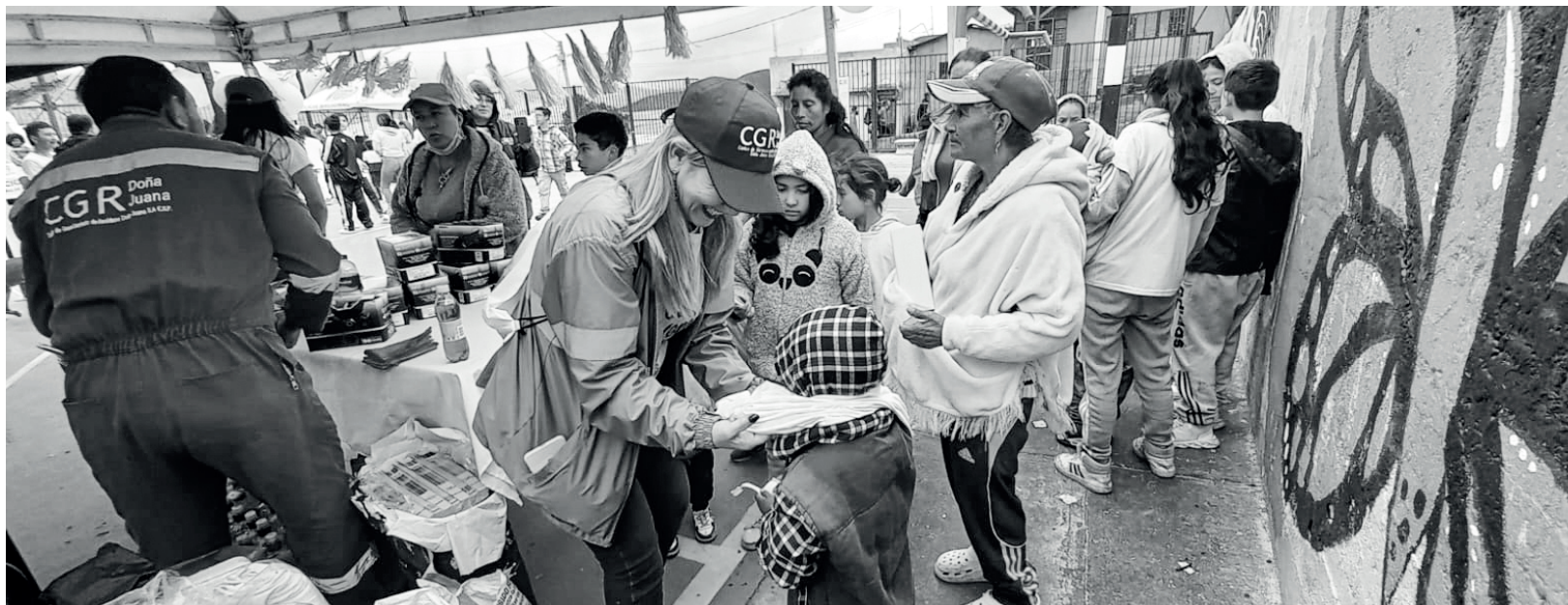
» Cada participante se llevó los recuerdos del club entregados por CGR.