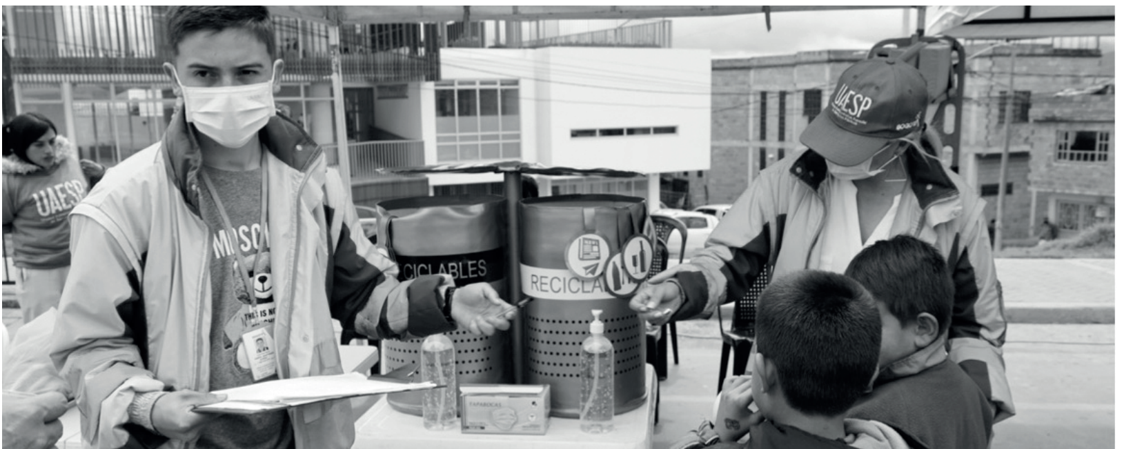
» En la Feria de Servicios participaron distintas entidades distritales y nacionales.