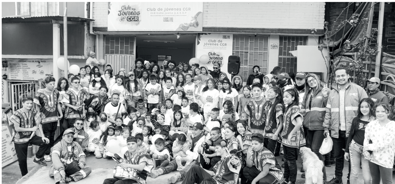
» Inauguración de la Casa Club de Jóvenes CGR, ubicada en la comunidad de Mochuelo Bajo.

» Por: Claudia Garrido/ RSE-C CGR Doña Juana