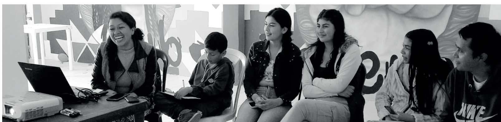
» Clase teórico-práctica sobre fotografía.

rural, Mochuelo hace parte de un territorio que se llama Ciudad Bolívar, que tiene miles de cosas por mostrar y que mejor que a través del amor por la fotografía. Agradezco a los niños, niñas y jóvenes del Club de Jóvenes de CGR por participar en los espacios de formación, así como al operador por incentivar estos procesos de formación.