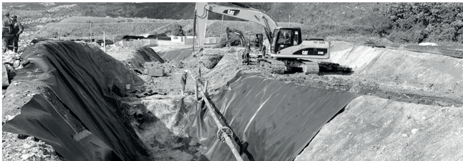
» Actividad de perforación dirigida.

Residuos que son sometidos a procesos de compactación a través de maquinaria destinada para esta actividad (Bulldozer, compactadora y retroexcavadoras) cumpliendo con el indicador de densidad estipulado en el Contrato 344 de 2010.