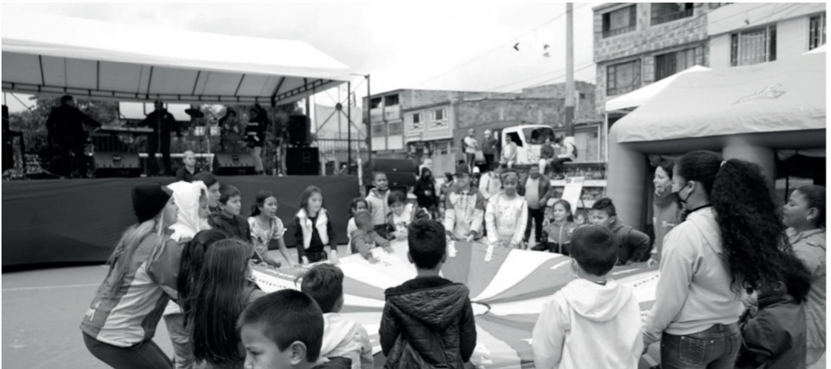
» Los niños y niñas de Mochuelo asistieron a la Feria de Servicios y participaron en actividades culturales y recreativas.