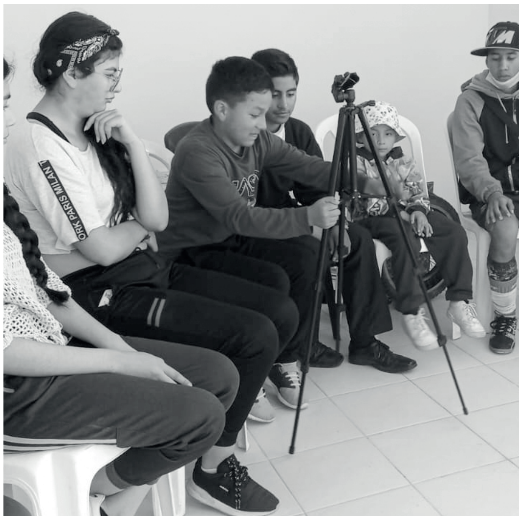
» Reconocimiento y utilización de trípodes, taller desarrollado en la Casa del Club de Jóvenes.

Es por esto que, las fotos se convierten en más que una imagen congelada, son fragmentos de la memoria de una persona, de un lugar, un suceso y una sociedad que se pueden recopilar y analizar para saber qué ha cambiado, qué se puede mejorar y qué podemos aportar en conjunto con los niños y jóvenes. Precisamente, gracias al inicio del curso de fotografía apoyado por