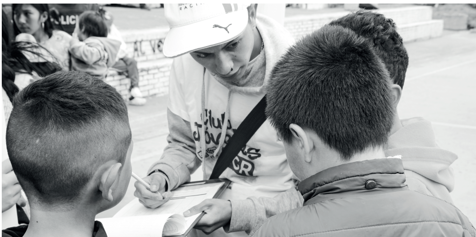
» Cada participante se llevó un recordatorio del Club de Jóvenes.

Durante la actividad, se realizó la entrega de recuerdos alusivos al club, una muestra empresarial de la zona, entrega de kits de bioseguridad y la inscripción a las diferentes actividades que se ofrecerán a los grupos.