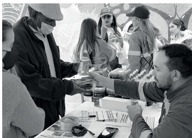
» Entrega de kits de bioseguridad.