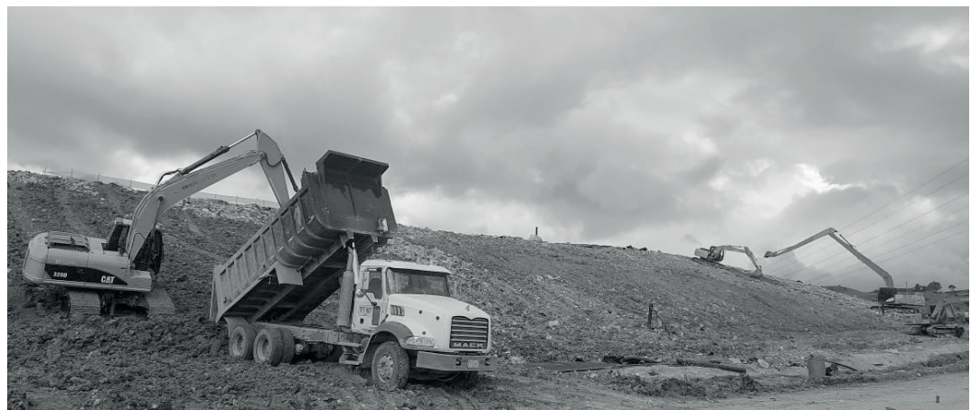
» Cobertura con arcilla, junio 2022.

“Se deben realizar los controles a tiempo para que no se presenten afectaciones hacia Los Mochuelos, así la comunidad está tranquila y el operador puede garantizar un buen proceso al interior de Doña Juana. En este periodo realizamos verificación de los compromisos por temas de olores, enfocada a la instalación de las teas para reducción de los olores ofensivos y también evitar áreas de residuos destapadas, realizando un buen cierre de la cobertura con arcilla y geomembrana 20mils, verificando avances para la evacuación de lixiviados; es por esto, que los espacios de participación que involucran a la comunidad han mejorado, ya que siempre están atentos a las inquietudes presentadas, esperamos seguir teniendo avances y que se cumplan los compromisos establecidos”, expresó.