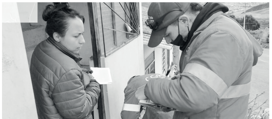
» Jornada de desratización barrio Barranquitos.