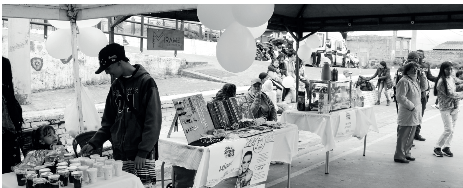
» Muestra empresarial, proyectos apoyados por CGR y negocios del territorio.

¡Si quieres ser parte de este gran club, acércate a las Oficinas de Relaciones con la Comunidad para más información!