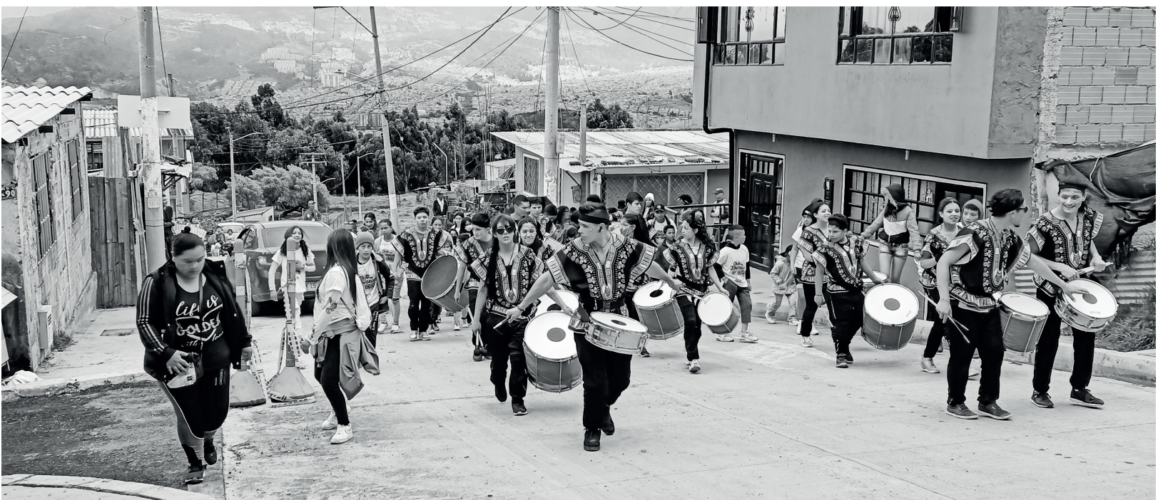
» Recorrido al ritmo de la Batucada.

Cerrando el espectáculo artístico, se dio inicio al recorrido liderado por la Gran Batucada y el equipo de RSE-C, en el cual se emprendió un trayecto por los barrios de Barranquitos y La Esmeralda, cuyo destino fue la Casa del Club de Jóvenes, inaugurada a través del corte del listón y la entrega de la llave a los cuatro líderes juveniles de la zona.