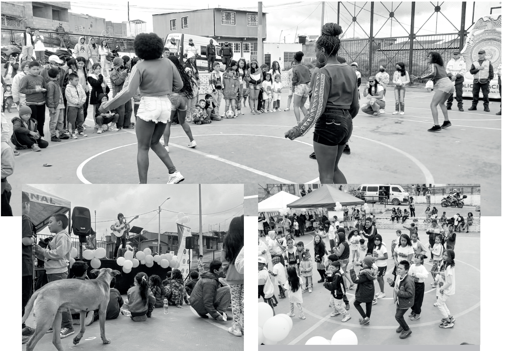
» Presentaciones artísticas.