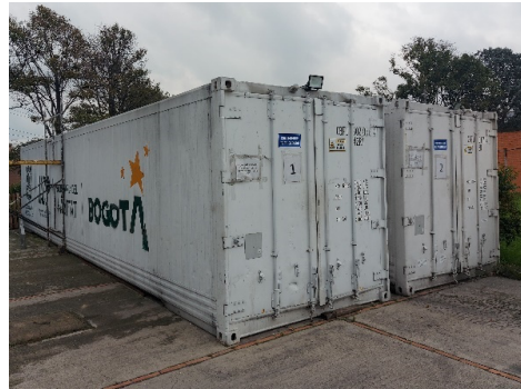
Deposito cadáveres COVID19