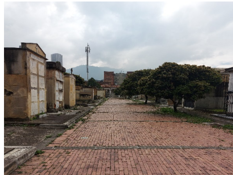
Instalaciones Cementerio Central