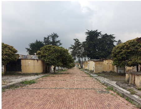
Instalaciones Cementerio Central