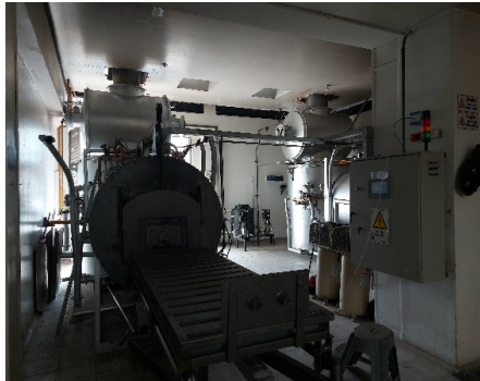
Horno Crematorio cementerio del sur