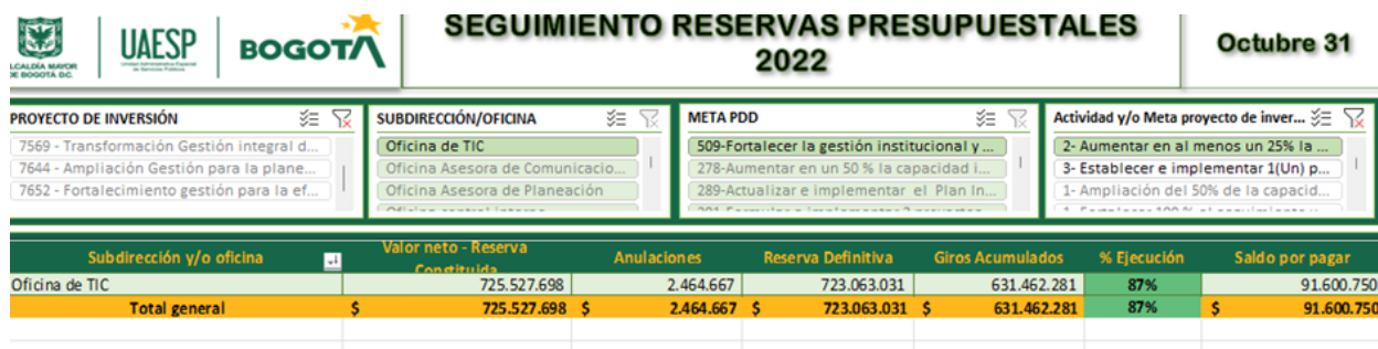
Imagen 2 Reservas meta 509-2 octubre

Reservas: Se observaron reservas por 725 millones COP, correspondientes a 22 compromisos presupuestales, de los cuales a 31 de diciembre de 2023 se giraron el 87%, sin embargo, queda una constitución de pasivos exigibles por valor de 92 millones de pesos colombianos. En esta meta se encontró un error de digitación ya que a octubre se reportaron giros por 631 millones y en diciembre giros por 615 millones como se evidencia en las siguientes imágenes