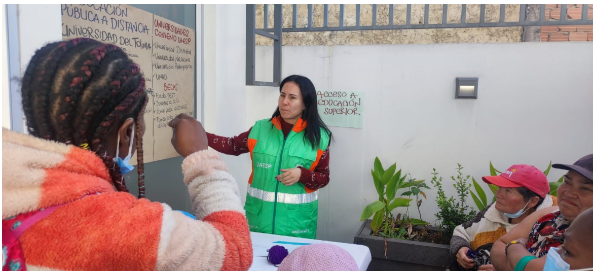
Acceso a Educación Superior

Como parte de las medidas de compensación, en esta mesa se socializa lo siguiente: