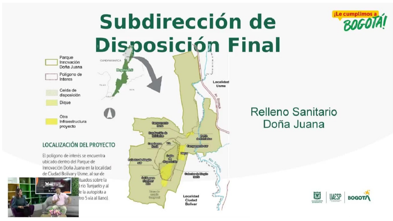
Imagen 6. Distribución del Parque de Innovación Doña Juana