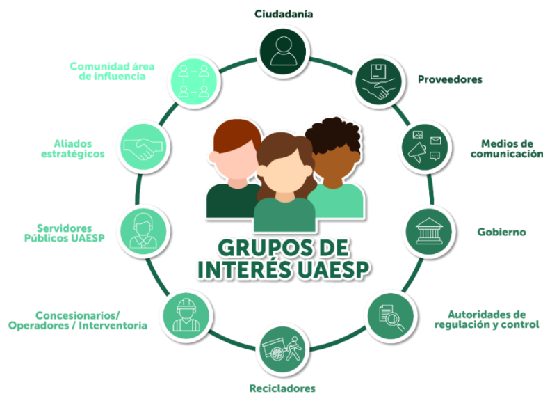
Imagen 1. Modelo de Relacionamiento UAESP

De acuerdo con lo establecido en el modelo de relacionamiento de la UAESP, se priorizaron los grupos que tienen relación directa e indirecta con el Plan de Gestión Integral de Residuos Sólidos, que tienen como objetivo el mejorar las condiciones de la prestación del servicio público de aseo, impulsar el modelo de economía circular, mejorar las condiciones de población recicladora de oficio, promover cambios culturales en la gestión de residuos, la aplicación de tecnologías de aprovechamiento y valorización de residuos sólidos urbanos.