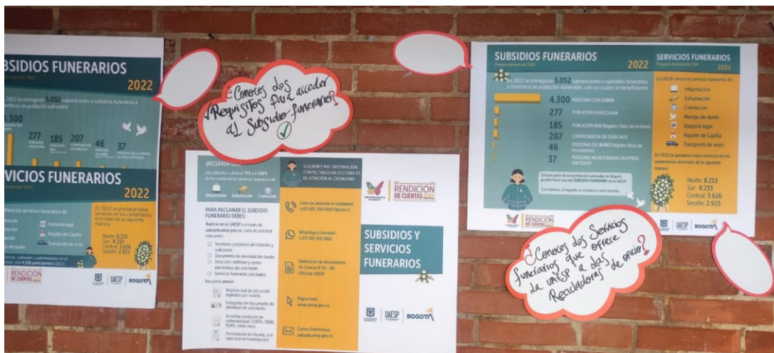
Ilustración 2 Muro RDC mujeres recicladoras de oficio

En este espacio se entrega la información relacionada con la gestión de la UAESP en la vigencia anterior, por medio de infografías que contienen la información de la gestión de las diferentes áreas de la entidad, se creó un espacio de exposición con enfoque de género. Con preguntas orientadoras buscando generar el dialogo con las mujeres al respecto de la gestión y la oferta con enfoque de género.