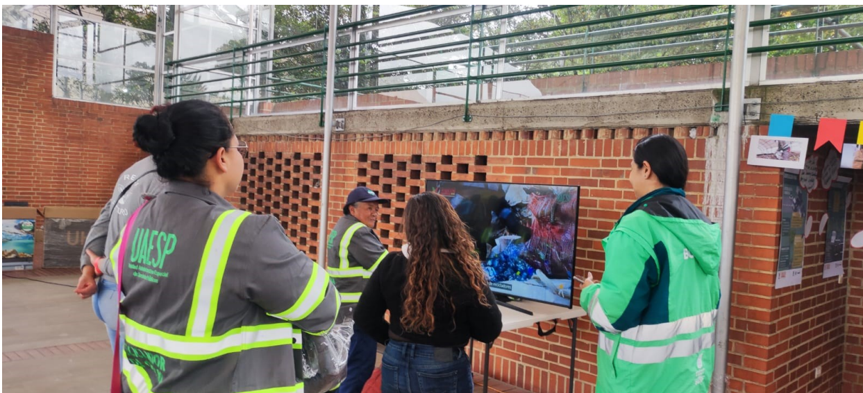
Ilustración 1 Mujeres recicladoras observando el video Acciones afirmativas 2022