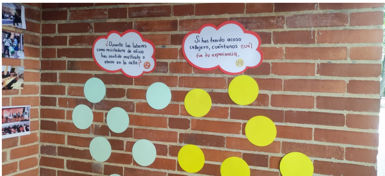
Ilustración 4 Muro preguntas sobre acoso callejero a mujeres recicladoras

Se genera un muro de participación consultando a las mujeres sobre acoso o abuso callejero, como sugerencia de la Secretaria de Hábitat.