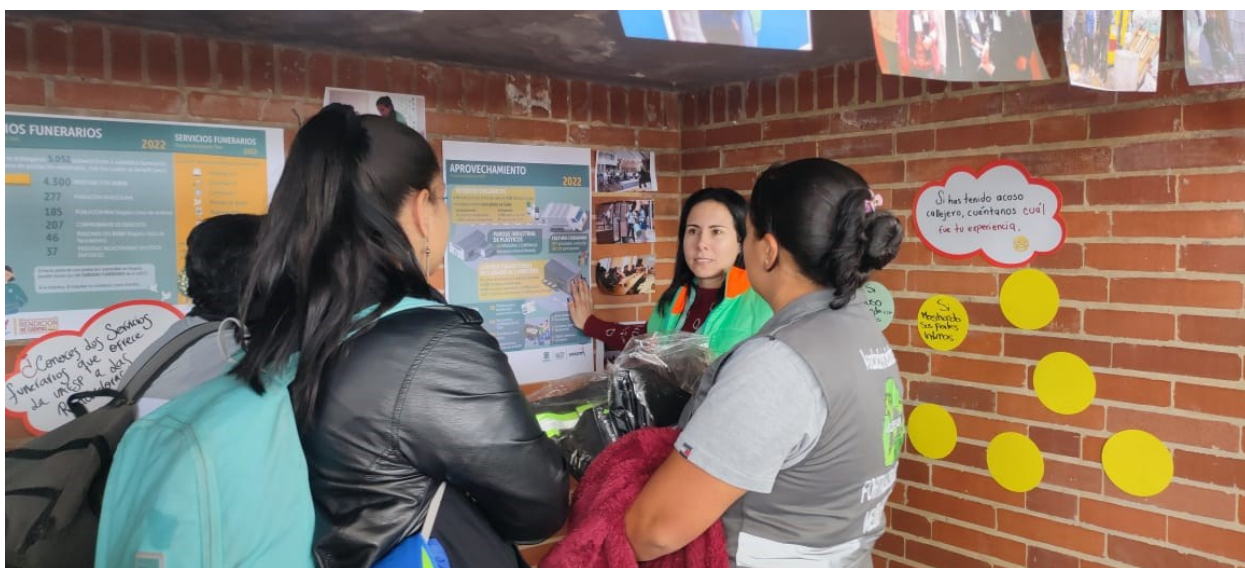
Ilustración 5 Mujeres recicladoras participando en espacio de diálogo de RDC

Afirmativo, con los extranjeros por el material Afirmativo, por ser mujer, por estar sola Afirmativo, por parte de una ama de casa, no saben reciclar Afirmativo, mostrando sus partes íntimas Afirmativo, acoso sexual del residente en el comercio especialmente Afirmativo, no nos tiene consideración Afirmativo, de otro reciclador Afirmativo, por venezolanos Afirmativo, “quítese ñero cochino, puerco” Afirmativo, “me persiguió, y dijo o se va o se va”