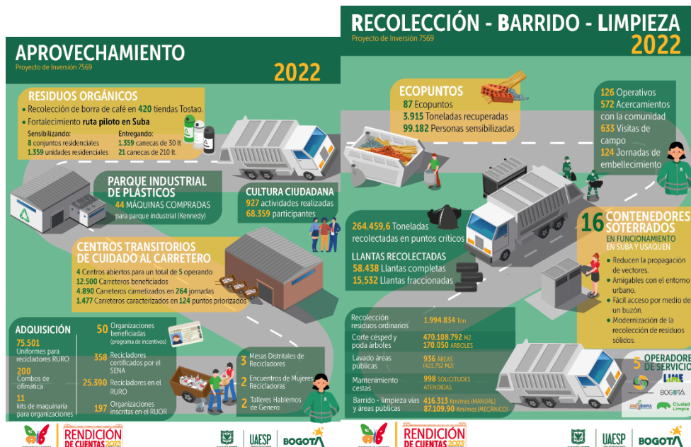
Ilustración 6 Infografía Gestión Subdirección de Aprovechamiento 2022

Por medio de estas infografías se presentan los principales datos, sobre la gestión 2022, de las diferentes áreas de la UAESP, se hace énfasis en la información que puede ser de utilidad a las recicladoras de oficio de Bogotá. En este espacio se responden preguntas que se suscitan a propósito de esta gestión.