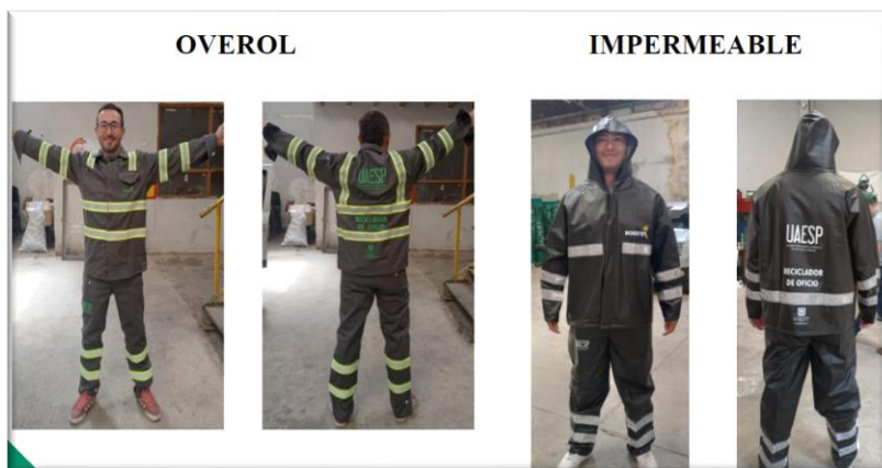
Ilustración 4 Uniformes entregados a recicladores de oficio.

La Unidad a partir del segundo trimestre de 2023, inició las entregas masivas a los recicladores de oficio registrados en el Registro Único de Recicladores de Oficio – RURO. Con corte a 30 de septiembre se han entregado 44.930 overoles e impermeables y se han beneficiado 13.116 recicladores de oficio.