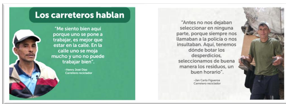
Ilustración 3. Carreteros

Además de tener un lugar para clasificar el material, los carreteros visitantes reciben la información de la oferta institucional del Distrito y son caracterizados por personal de la UAESP, tienen acceso a servicio de baños y reciben bebidas calientes para desarrollar su labor.