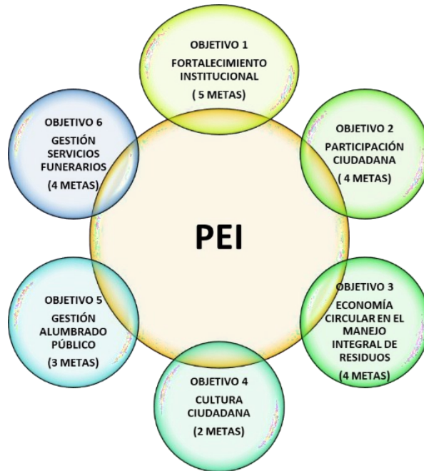
Figura 1 Objetivos Estratégicos de la UAESP