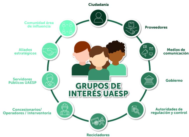
Figura 4 Grupos de Interés de la UAESP