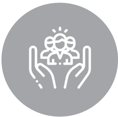
Asistencia Social Lúdica y Recreativa

Como compromiso social hacia la comunidad de Mochuelo Alto y Mochuelo Bajo las Líneas de Acción son creadas para el aprovechamiento, construcción, participación y bienestar de los habitantes de la zona.