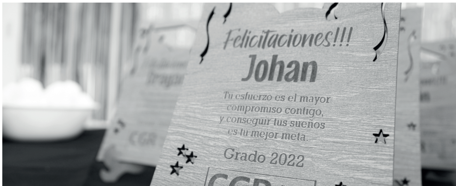
» Recordatorio entregado por CGR a cada uno de los graduados.