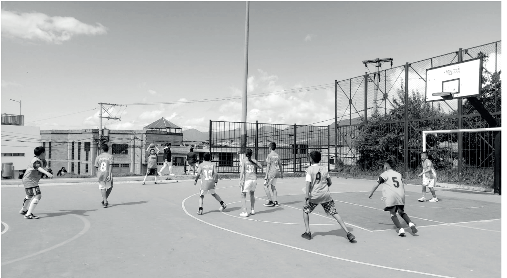
» Partido de inauguración.