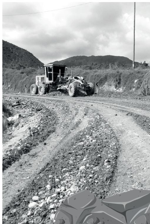
» Vía alterna actual.