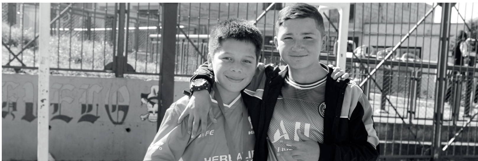
» La unión entre niños y jóvenes de la comunidad es el objetivo común de las entidades presentes en el territorio.

» Líder de territorio para la Fundación Pocalana ha trabajado incansablemente con los diferentes grupos poblacionales de la comunidad de Los Mochuelos.