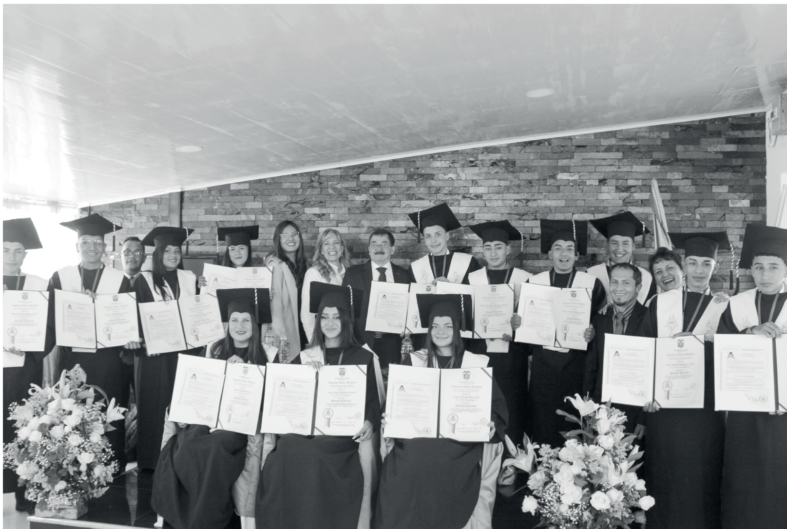
» Grupo de bachilleres, CGR y el Instituto Académico André Michelin.