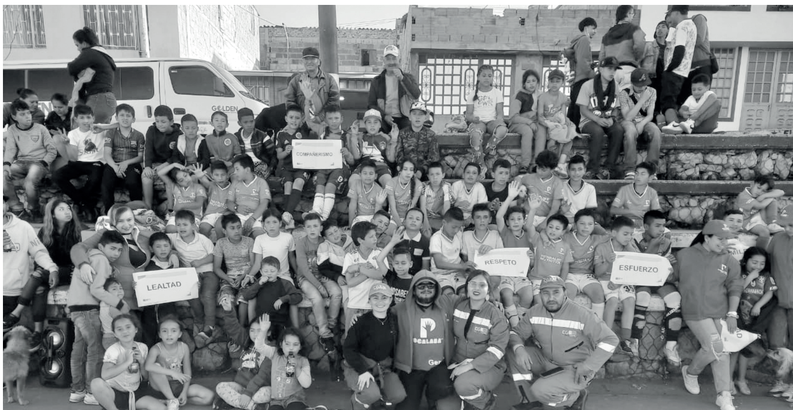
» El Mundialito fue realizado en la cancha del barrio Paticos en Mochuelo Bajo.

La responsabilidad, solidaridad, compañerismo, lealtad, humildad y esfuerzo fueron los valores que tenía asignado cada equipo, a través de los cuales debían explicar la correlación y su importancia en el fútbol sala. Los equipos invitados fueron: Fundación Palagus, Fundación Pocalana y equipo CGR Doña Juana, por parte del operador se realizó entrega de medallas, refrigerios y juguetes.