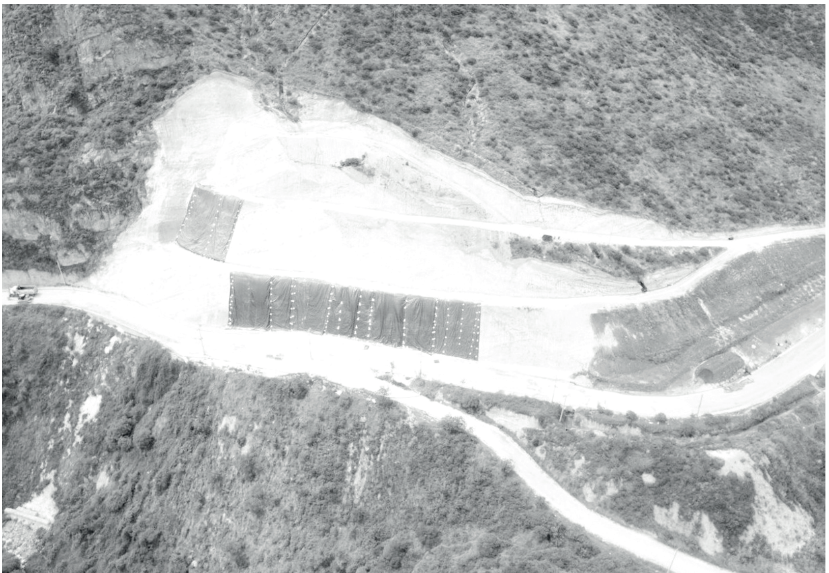
» Obra de estabilización Poste 53, cobertura temporal de los taludes.