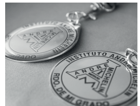
» Medallas diseñadas por el Instituto André Michelin, entregadas como recuerdo a cada bachiller.