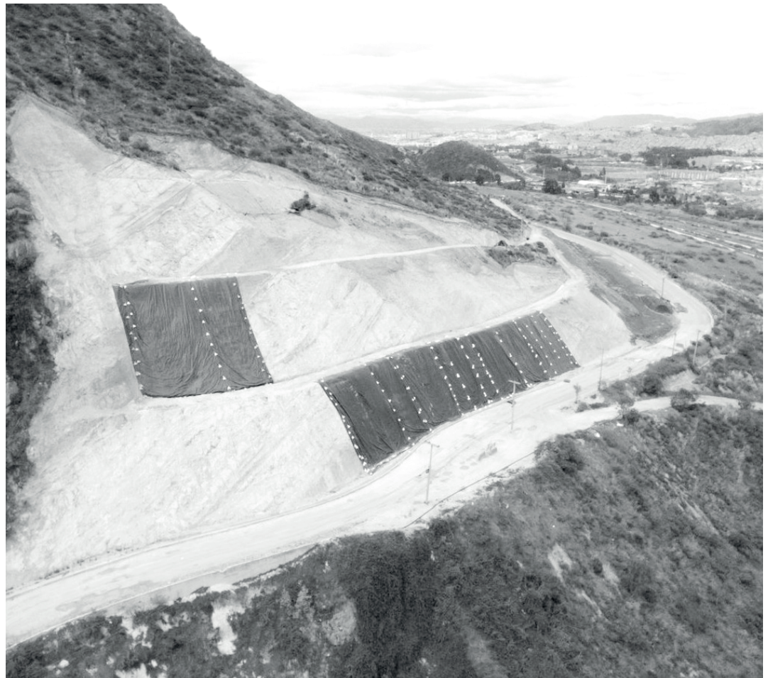
» Obra de estabilización Poste 53, cobertura temporal de los taludes.