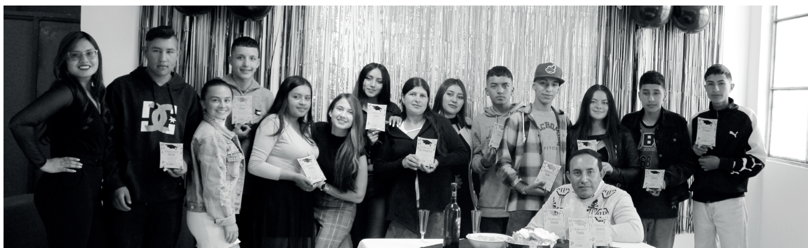
» El Club de Jóvenes de CGR fue el recinto escogido para la celebración. “Tu esfuerzo es el mayor compromiso contigo y conseguir tus sueños es tu mejor meta”.