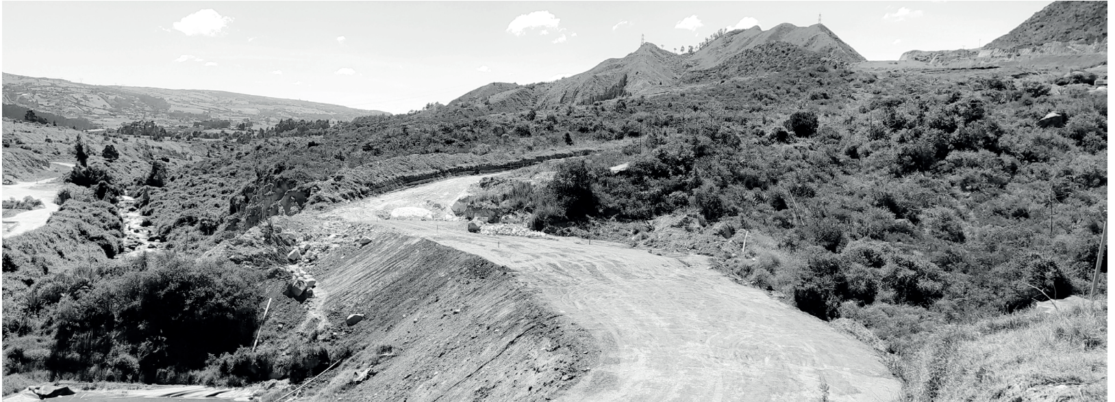
» Inicio de la construcción de la vía alterna hacia el costado oriental de la Zona IV.

» Por: Iván Pedraza / Estudios y Diseños - Claudia Garrido / RSE-C CGR Doña Juana