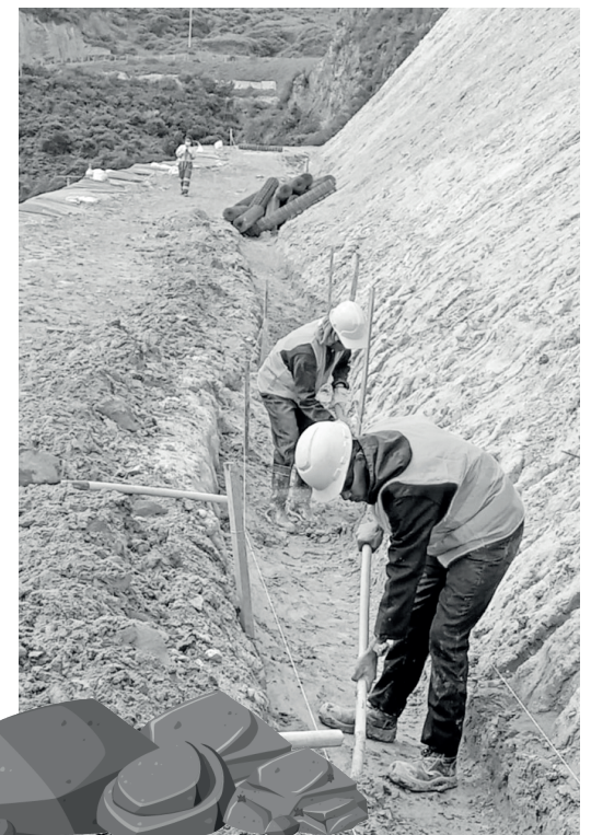
» Construcción de cunetas perimetrales en concreto reforzado.