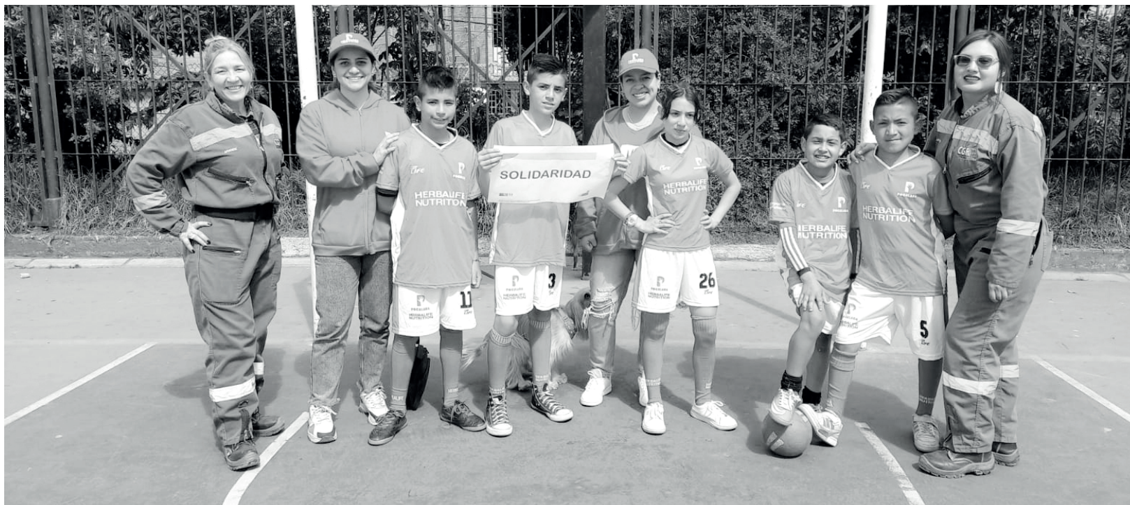
» Equipo de CGR Doña Juana y Fundación Pocalana.