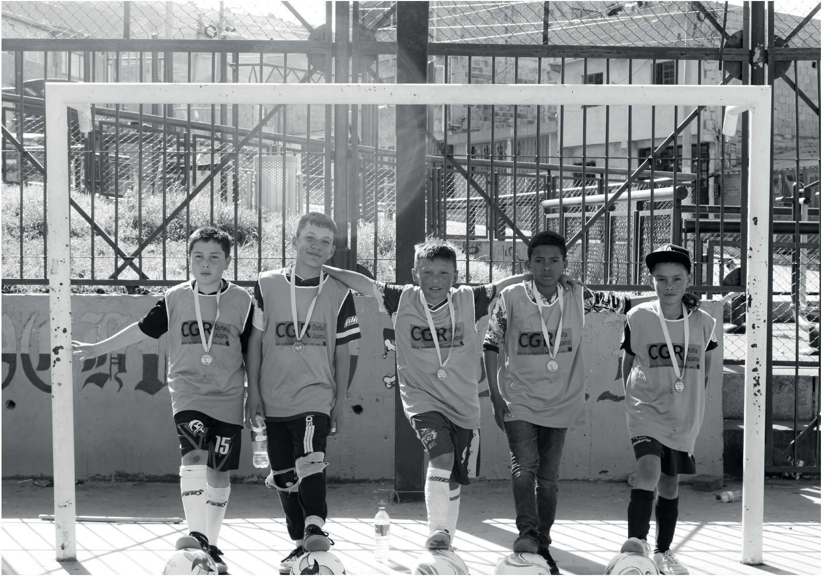
» Grupo infantil de fútbol sala CGR Doña Juana.