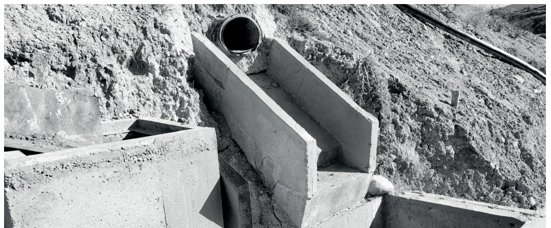
» Manejo de aguas lluvias.