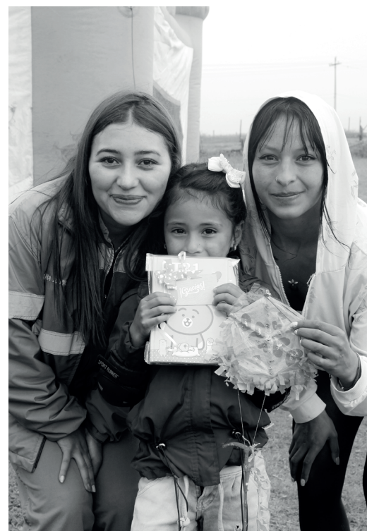
» Ganadoras del concurso de la cometa más pequeña, 8 cm de largo.

La actividad se realizó el 22 de agosto y se premió la cometa más grande, la más pequeña y la más creativa, permitiendo evaluar todos los aspectos definidos por el proceso de Responsabilidad Social Empresarial y Comunicaciones. “El eje fundamental de esta actividad se desarrolló en el marco de la unión familiar, garantizando que la creatividad para realizar este juguete tuviera la complicitad de todos en sus hogares. Es por esto, que desde el proceso social del operador queremos brindar este tipo de espacios en donde los niños y jóvenes aprendan la importancia de trabajar en conjunto, al mismo tiempo que depositan su confianza en su núcleo familiar”, afirmó Carolina Marín, profesional social de CGR y líder de la actividad.