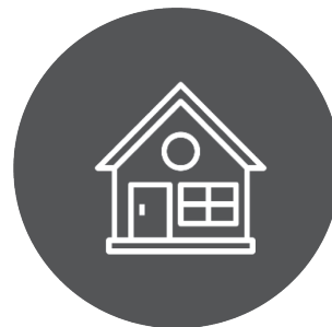
Mejoramiento de espacios comunitarios