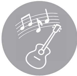
Cultural y artística

Como compromiso social hacia la comunidad de Mochuelo Alto y Mochuelo Bajo las Líneas de Acción son creadas para el aprovechamiento, construcción, participación y bienestar de los habitantes de la zona.