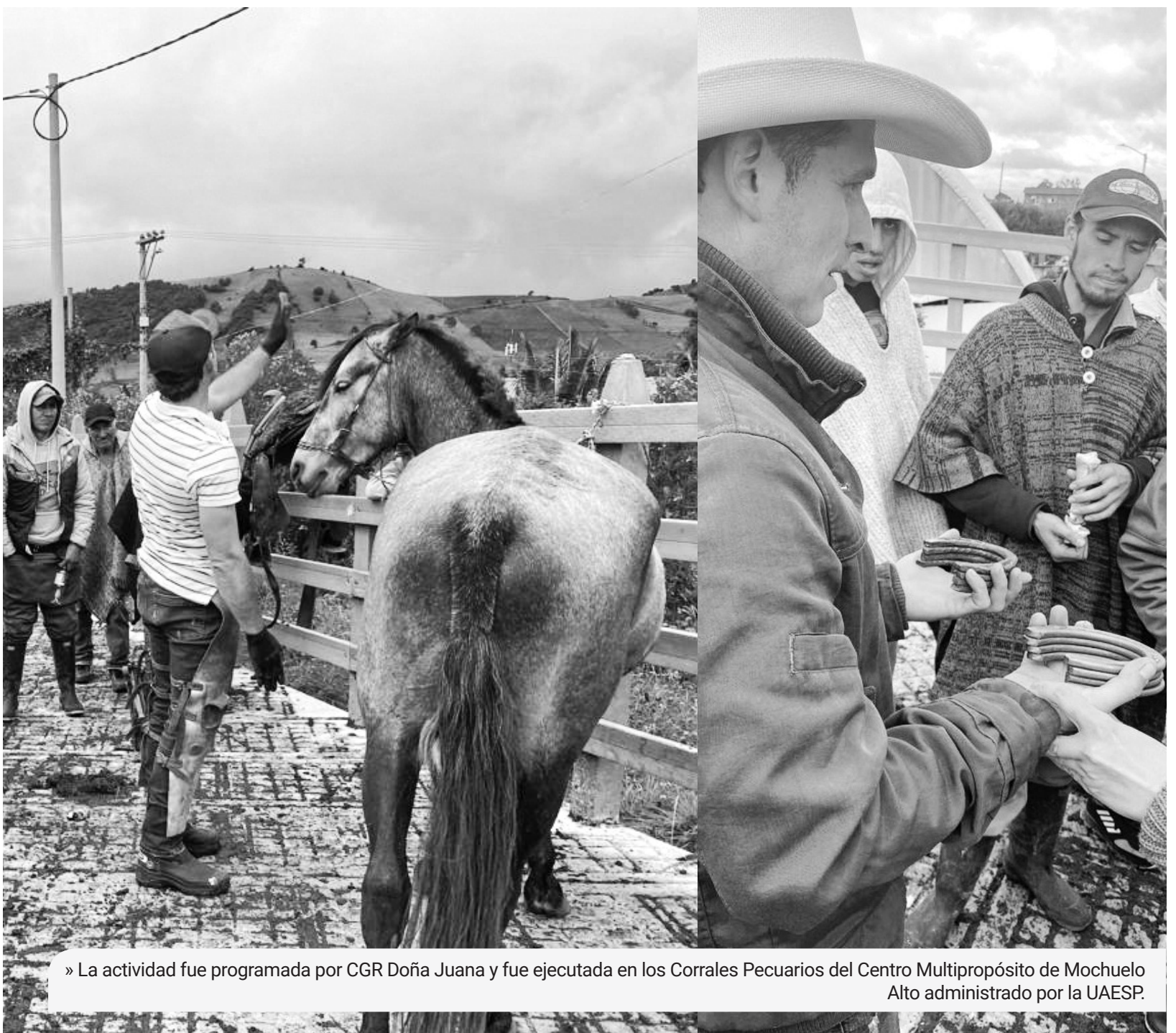
» La actividad fue programada por CGR Doña Juana y fue ejecutada en los Corrales Pecuarios del Centro Multipropósito de Mochuelo Alto administrado por la UAESP.

La actividad se realizó en Mochuelo Alto, con un balance satisfactorio. CGR invita a la comunidad a que se involucre en estos procesos, a través de los cuales se implementan acciones de concientización, que promueven a generar cambios significativos en los entornos y condiciones de vida de estos seres sintientes.