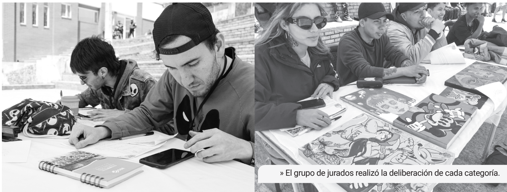
» El grupo de jurados realizó la deliberación de cada categoría.